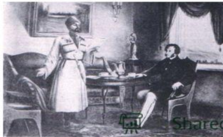
Шора Ногмов и А. С. Пушкин (С картины художника И. В. Валицкого)

К сожалению произведения Шоры Ногмова в письменном виде почти не сохранились.