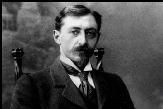
Иван Алексеевич Бунин