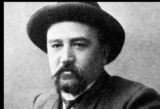
Александр Иванович Куприн