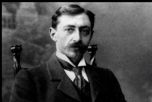
Иван Алексеевич Бунин