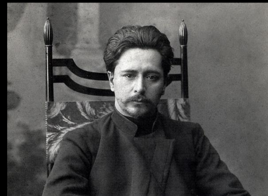
Леонид Николаевич Андреев