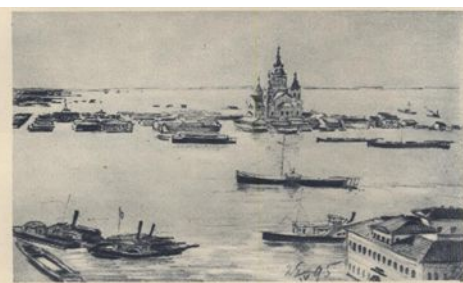
В. Г. Короленко. Радлив Оми в Нижнем-Новгороде. 1895.