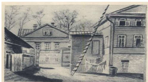
В. Г. Короленко. Нижний-Новгород. Дом на Бальгичной, в котором жил В. Г. Короленко. 1885.