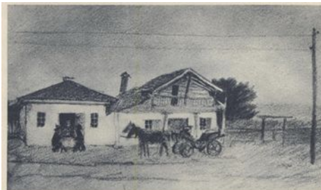
В. Г. Короленко. Из поездки по Румынии. 1897.