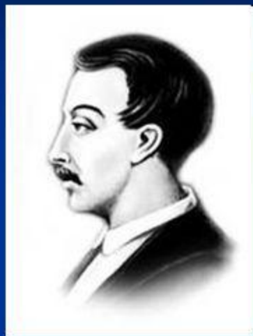
Вильгельм Кюхельбекер («Кюхля»)