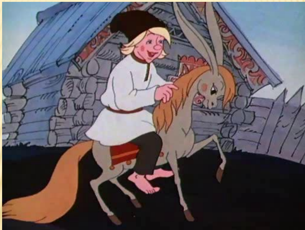
Конек горбунок (волшебная)