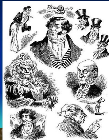
Н. Кузьмин. Персонажи комедии.