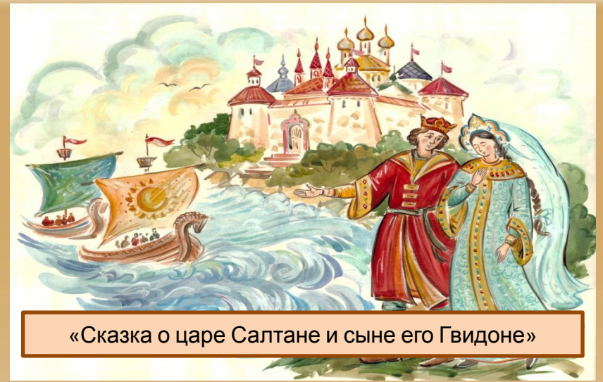
«Сказка о царе Салтане и сыне его Гвидоне»

Творчество Жуковского известно нам во многом благодаря его сказкам. Пушкин считал себя учеником Василия Андреевича, ведь именно его сказки вдохновили молодого Александра на создание собственных шедевров.