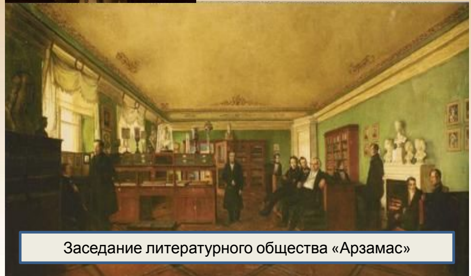
Заседание литературного общества «Арзамас»

В 1815 г., когда вышло первое собрание стихотворений Жуковского, его считали уже лучшим поэтом.