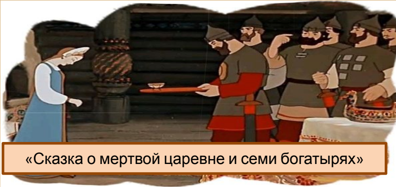
«Сказка о мертвой царевне и семи богатырях»

В 1831 году Пушкин представил своему другу "Сказку о попе и работнике его Балде" и несколько других набросков. Жуковский высоко оценил произведения и предложил вступить в шуточное соревнование. Спор Жуковского и Пушкина касался написания сказок в народном стиле. Так появились знаменитые "Сказка о царе Салтане и сыне его Гвидоне..." и "Сказка о мертвой царевне..." Пушкина, а также сказки Жуковского "О царе Берендее" и "О спящей царевне".