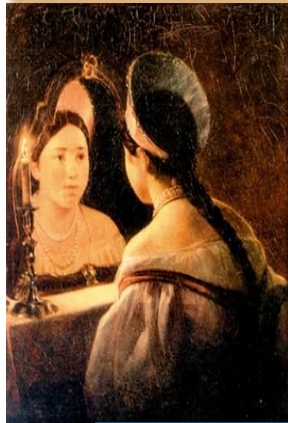
Иллюстр. к балладе «Светлана»

В 1773 году Готфрид Бюргер пишет свою балладу «Ленора» и становится основоположником этого жанра в Германии. Жуковского заинтересовывает его произведение, он делает три перевода книги. В 1808 году Жуковский даёт главной героине имя - Людмила, а в 1812 – Светлана.