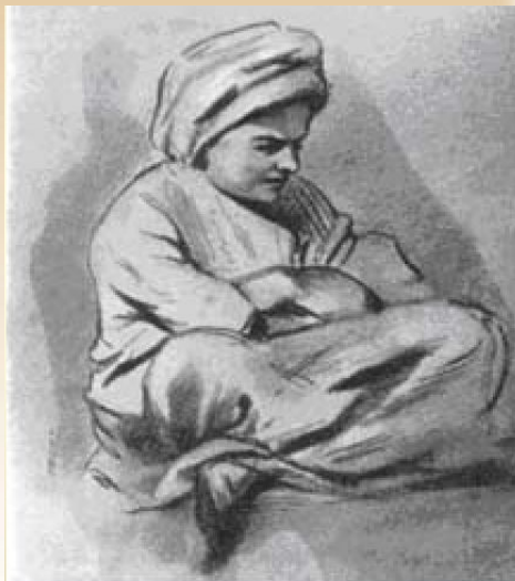
Рисунок 14-летнего Жуковского