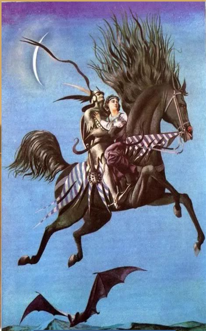
Иллюстр. к балладе «Людмила»