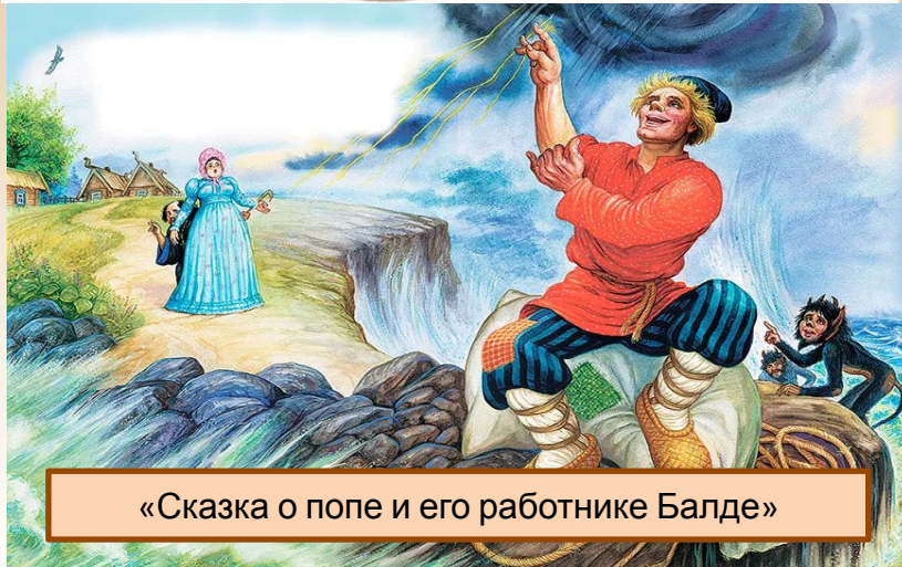
«Сказка о попе и его работнике Балде»