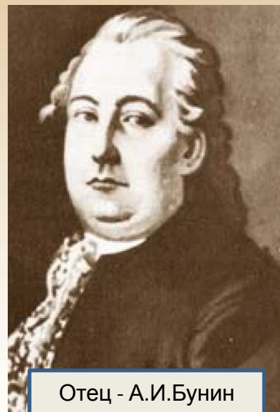
Отец - А.И.Бунин