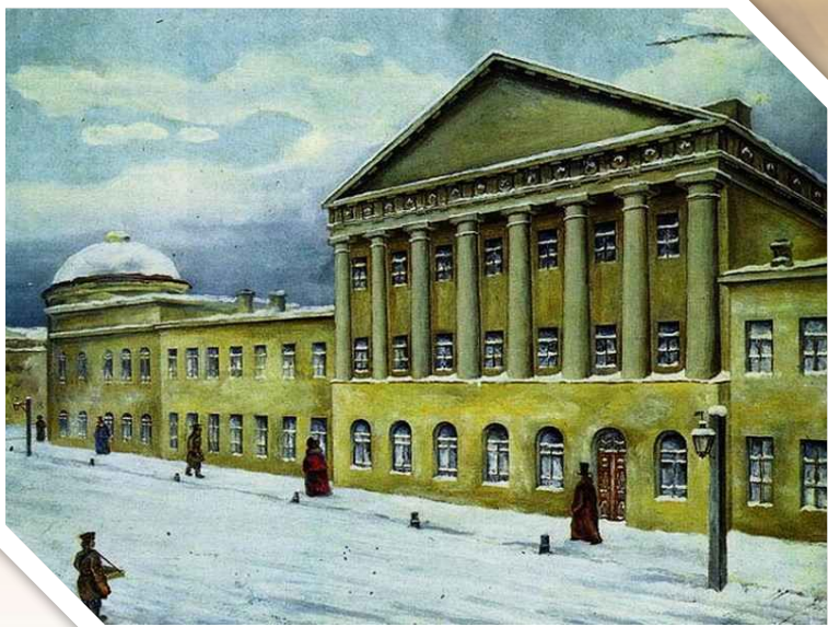
Благородный пансион при Московском университете

Элегия – лирическое стихотворение, проникнутое смешанным чувством радости и печали или только грустью, раздумьем, размышлением.