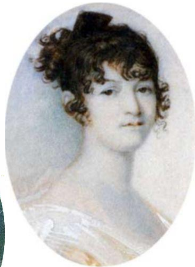
Надежда Осиповна Пушкина (Ганнибал)