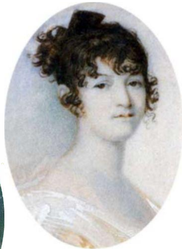
Надежда Осиповна Пушкина (Ганнибал)