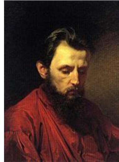
«Портрет В. Г. Шварца», (1870)

Родился в Кременчуге в бедной мещанской семье. Писал в стиле реализм.