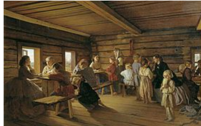
«Сельская бесплатная школа», 1865

Родился в семье художника в Санкт-Петербурге. Живописец народного быта и портретист.