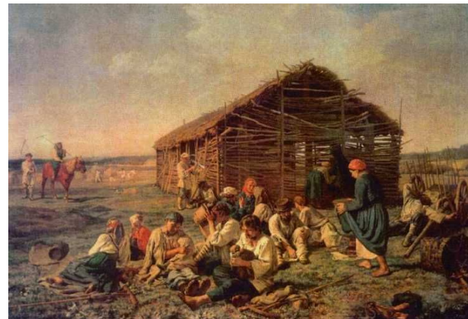
«Отдых на сенокосе», 1861