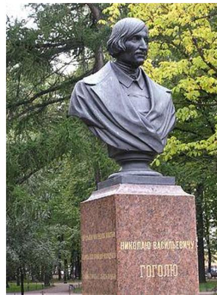
Памятник Н. В. Гоголю, 1896