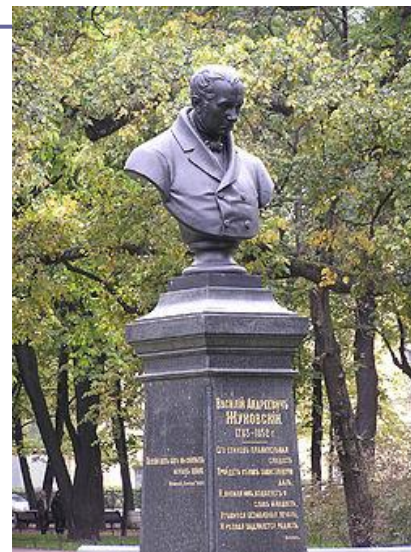
Памятник В. А. Жуковскому, 1887

Родился в Фредриксхамне Выборгской губернии в семье скульптора и резчика немецкого происхождения. Занимался портретной скульптурой.