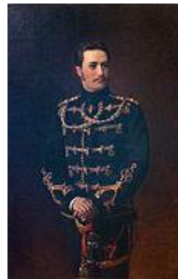
«Портрет поручика Лейб-Гвардейского Гусарского полка, графа Г.А. Бобринского» 1879