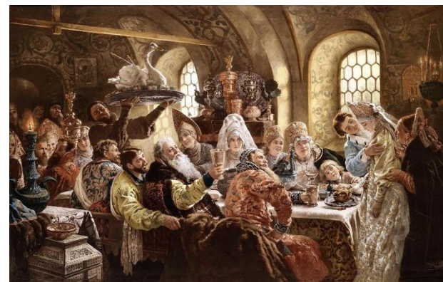
«Боярский свадебный пир» 1883.

Родился в Москве, старшим сыном в семье российского деятеля искусств и художника- любителя. Работал в стиле академизм.