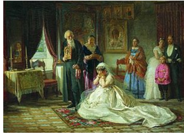
«Перед венцом», 1874

Родился в семье мещан. Жанр его картин – бытовая живопись.