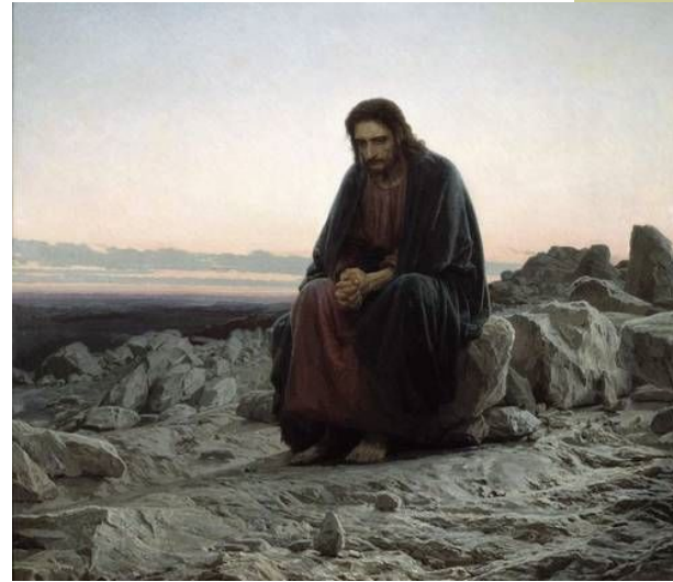
«Христос в пустыне», 1872