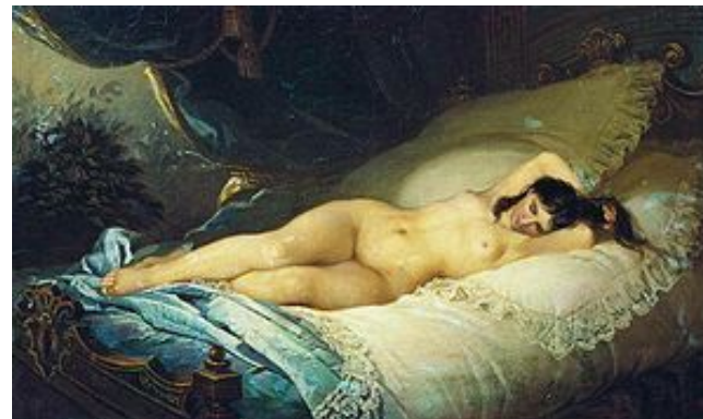
«Нагая женщина», 1901