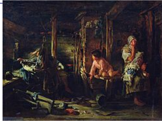
«Пьяный муж», (1894)

Родился в семье московского преподавателя музыки. Работал в стиле реализм.