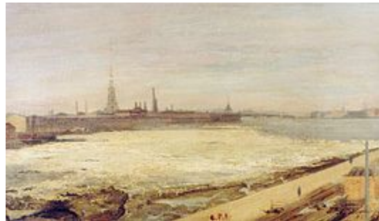
«Ледоход в Петербурге (Ледоход на Неве)», (1881)