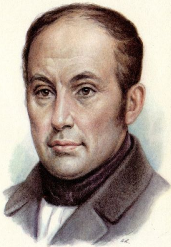
Василий Андреевич Жуковский 1783 – 1852