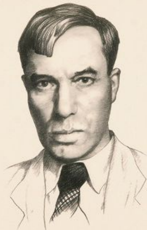
Борис Леонидович Пастернак 1890—1960