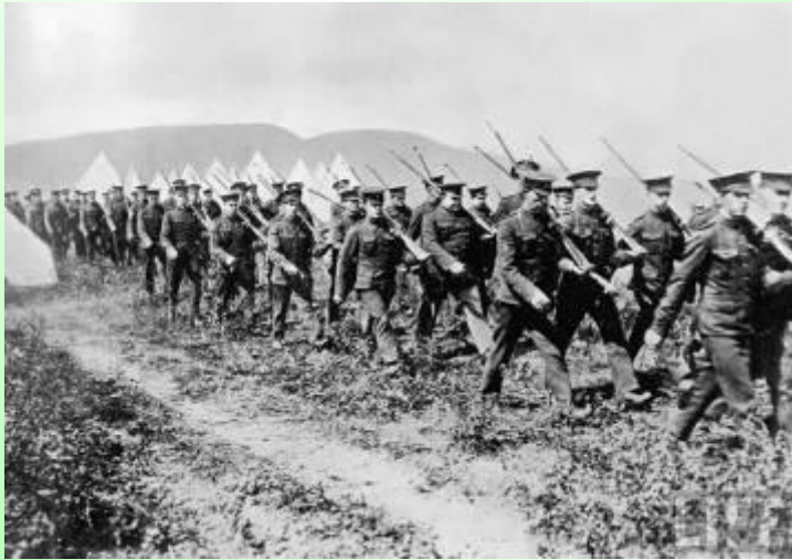
Фото с Первой мировой войны