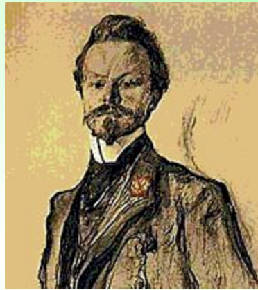
К. Д. Бальмонт