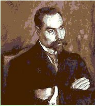
В. Я. Брюсов