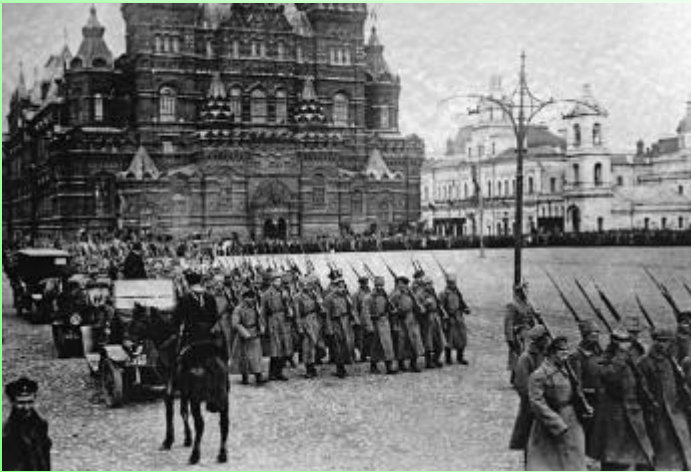
Ноябрь 1917 года

Начало Первой мировой войны воспринял как общечеловеческое бедствие, русскую революцию 1917 — как возможный выход из глобальной катастрофы.