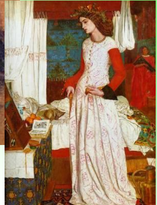
РОССЕТТИ (Rossetti) Данте Габриел