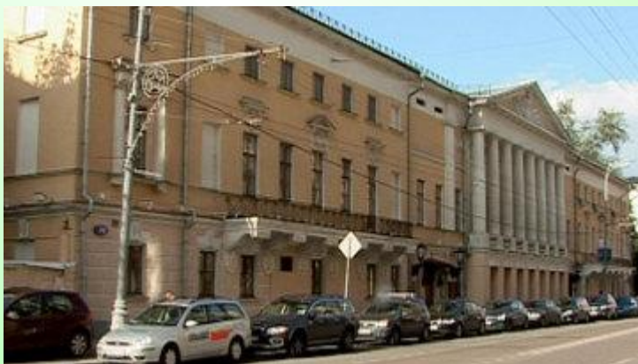
Частная гимназия Л. И. Поливанова