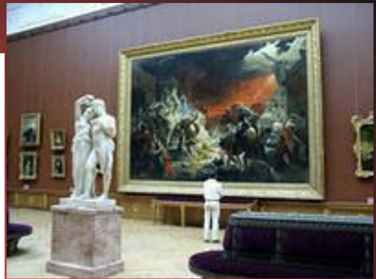
К. Брюллов. Последний день Помпеи.