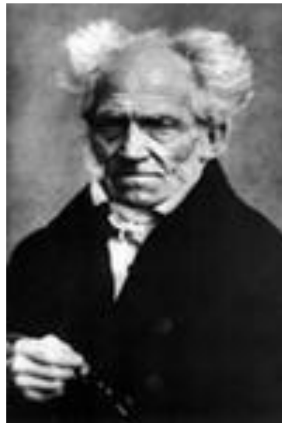
«философия пессимизма» Шопенгауэр