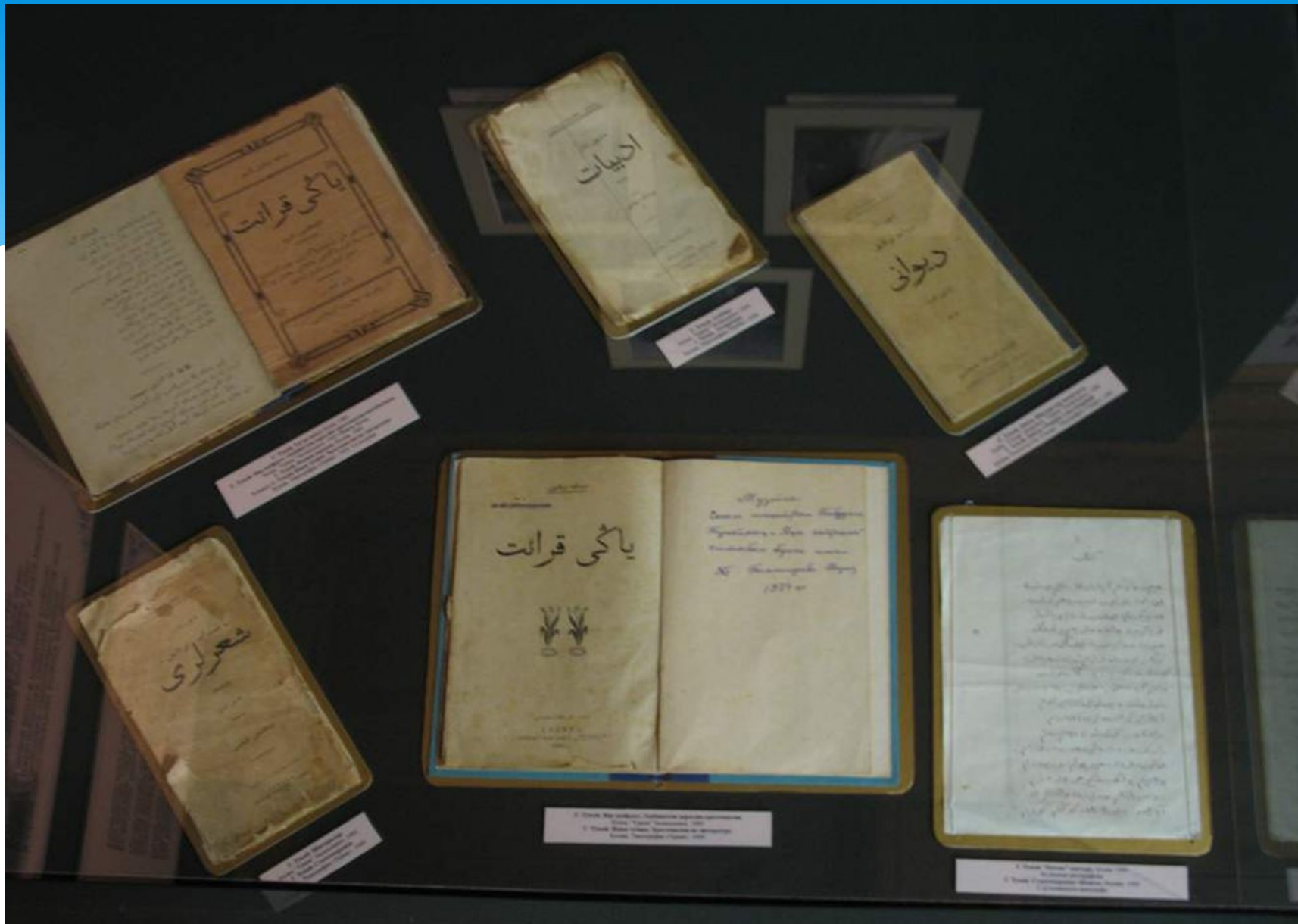
1. کتاب «یا لکی قرانت» (Yalaki Quran) - نسخه خطی، قرن ۱۲ هجری قمری. این کتاب یکی از مهم‌ترین آثار ادبی و تاریخی است که به دلیل سبک نگارش و محتوای ارزشمندش شناخته می‌شود.