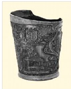
Кургашыннан коелган савыт.