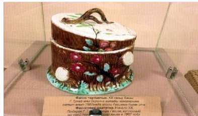
Фаянс тартмачык(карандаш савыты).