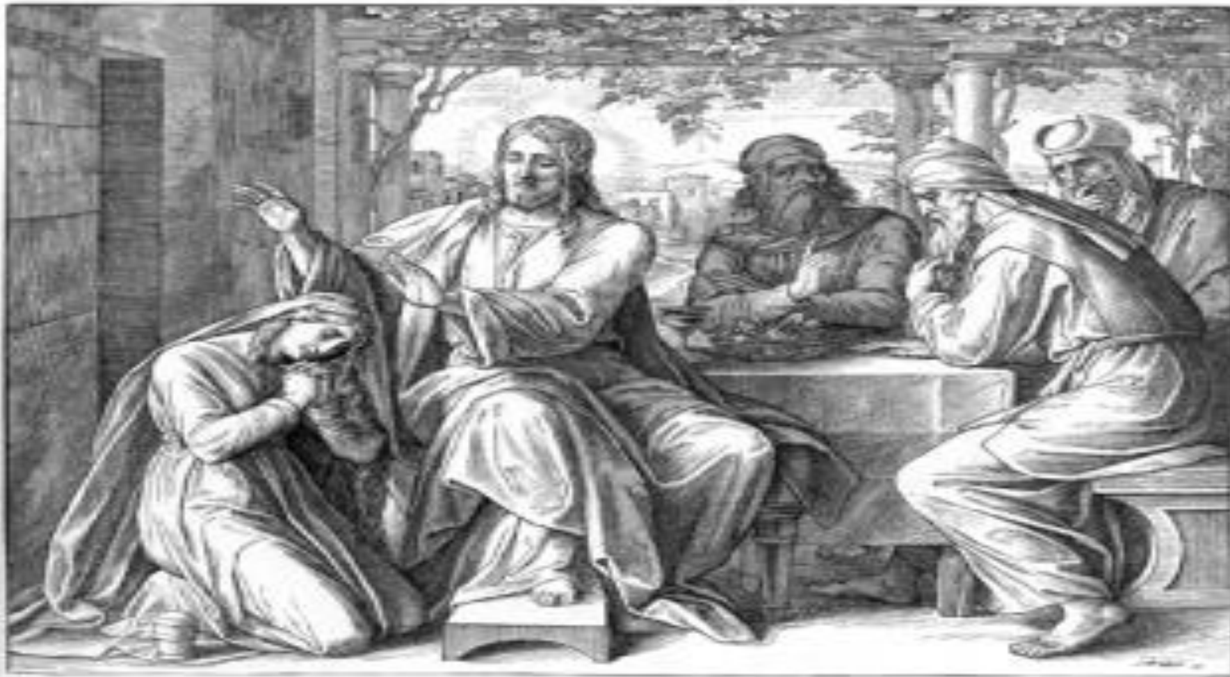
Изображение по Луке 7:36-50