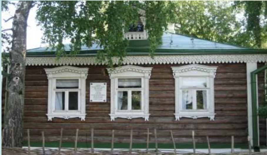
Дом родителей Есенина

Сергей Есенин родился 3 октября 1895 года в селе Константиново.