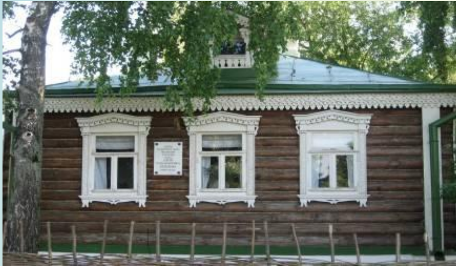
Дом родителей Есенина

Сергей Есенин родился 3 октября 1895 года в селе Константиново.