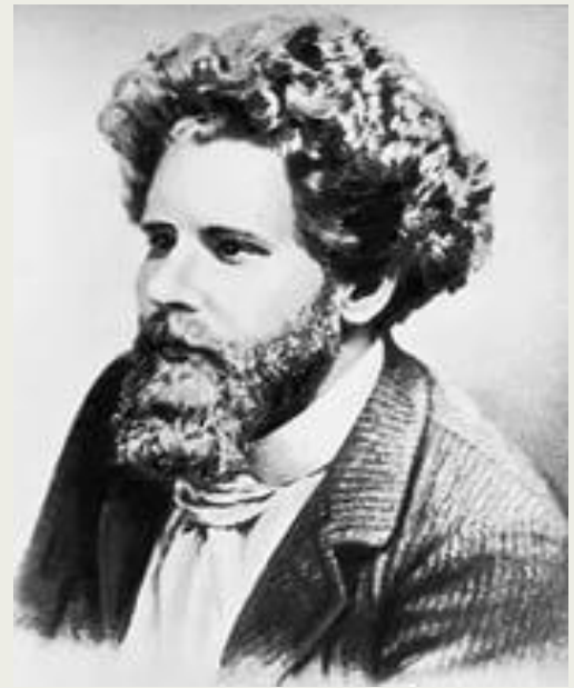
Волошин Максимилиан Александрович

Искусство его — игра. В детских играх раскрываются самые тайные, самые смутные воспоминания души, встают лики древнейших стихийных духов» — М. Волошин