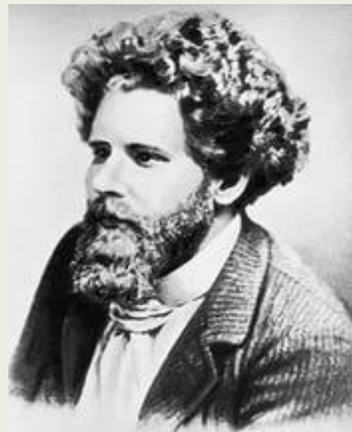
Волошин Максимилиан Александрович

Искусство его — игра. В детских играх раскрываются самые тайные, самые смутные воспоминания души, встают лики древнейших стихийных духов» — М. Волошин