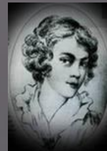
Мария Андреевна Протасова. Рисунок В.А.Жуковского. 1811