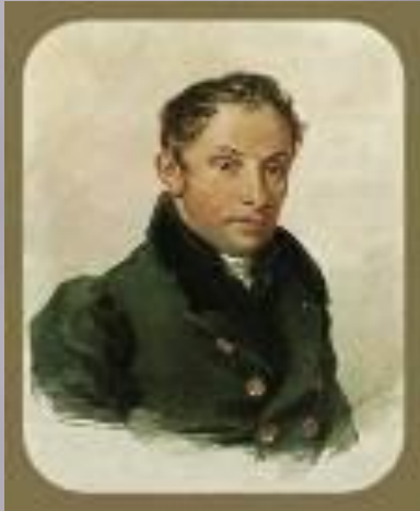
Отец Жуковского – Афанасий Иванович Бунин, помещик тульской губернии