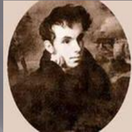
Ф.П.Соколов. Портрет Жуковского в 20-е годы.