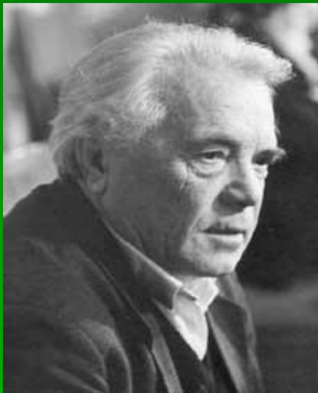
Виктор Петрович Астафьев