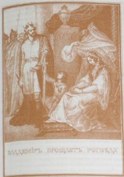
ВЛАДИМИРЪ ПРОЩАЕТЪ РОГНЕДУХЪ

Деталист наш удивлял, каким образом проповедники Вир-долженствовали говорить с Владимиром; но ежели греческий