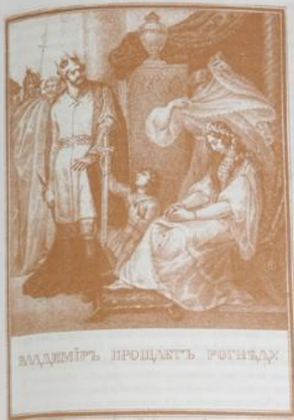
ВЛАДИМИРЪ ПРОЩАЕТЪ ПОГНЕВУХЪ

Детявщик наш удивлял, каким образом проповедники Вир-долженствовали говорить с Владимиром; но ежели греческий