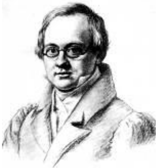
Антон Антонович Дельвиг