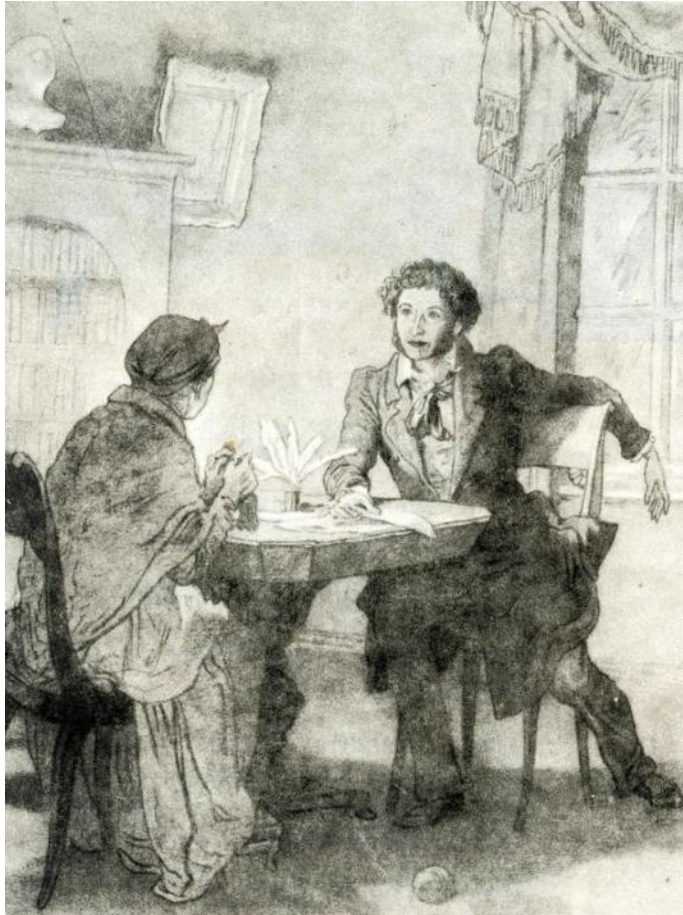
Иллюстрация к стихотворению «Зимний вечер»

Забота и любовь Арины Родионовны скрашивали поэту ссылку. Пушкин по-настоящему крепко любил свою няню и написал несколько трогательных стихотворений, к ней обращенных.