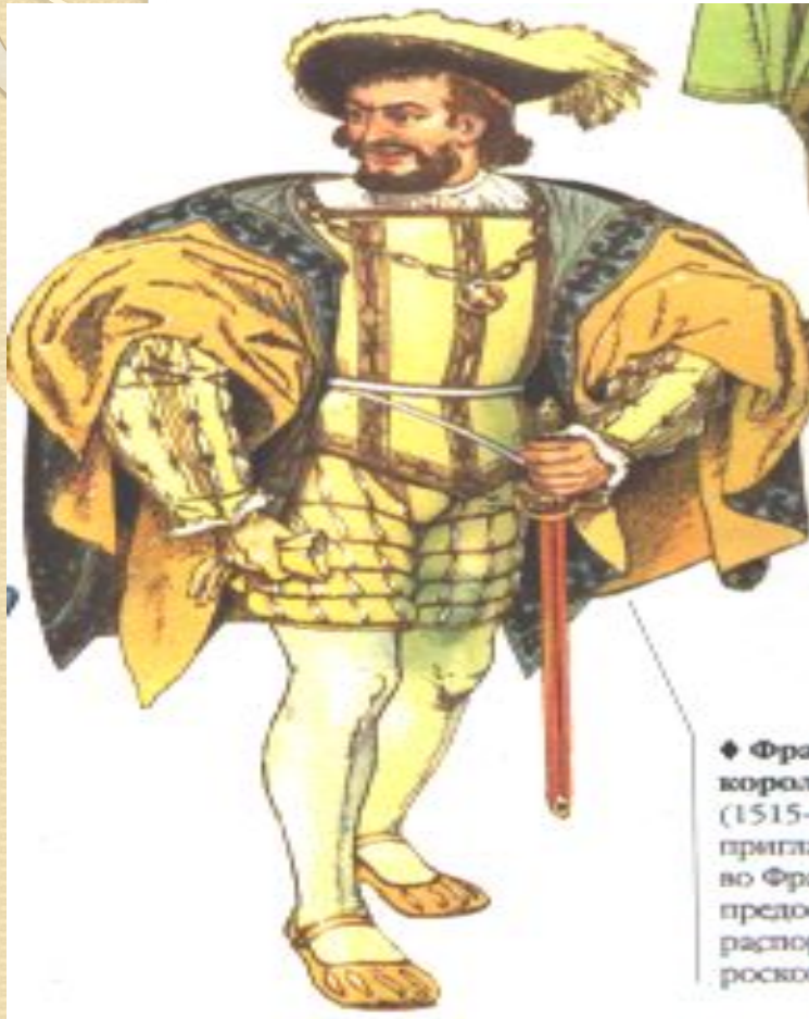
◆ Франк король (1515-1516) приглашен во Францию предосторожно

Чудовищность преступления меркнет перед ловкостью и отвагой совершенного.