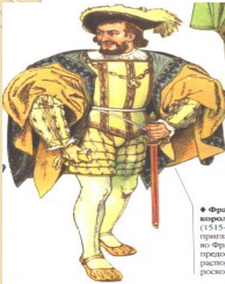
◆ Франк король (1515- пригл во Фран предо распо роско

Чудовищность преступления меркнет перед ловкостью и отвагой совершенного.