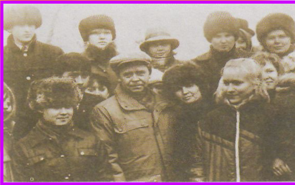
Среди молодых читателей.

Иногда делили писателей на городских и деревенских. А вот его начисляли к деревенским, хотя он уже давно жил в городе.