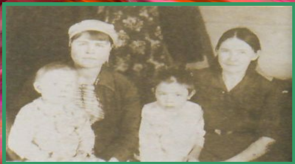
В. Распутин на коленях у матери.