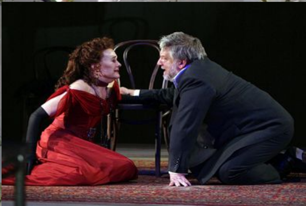
Саймон Рассел Бил в роли Лопехина