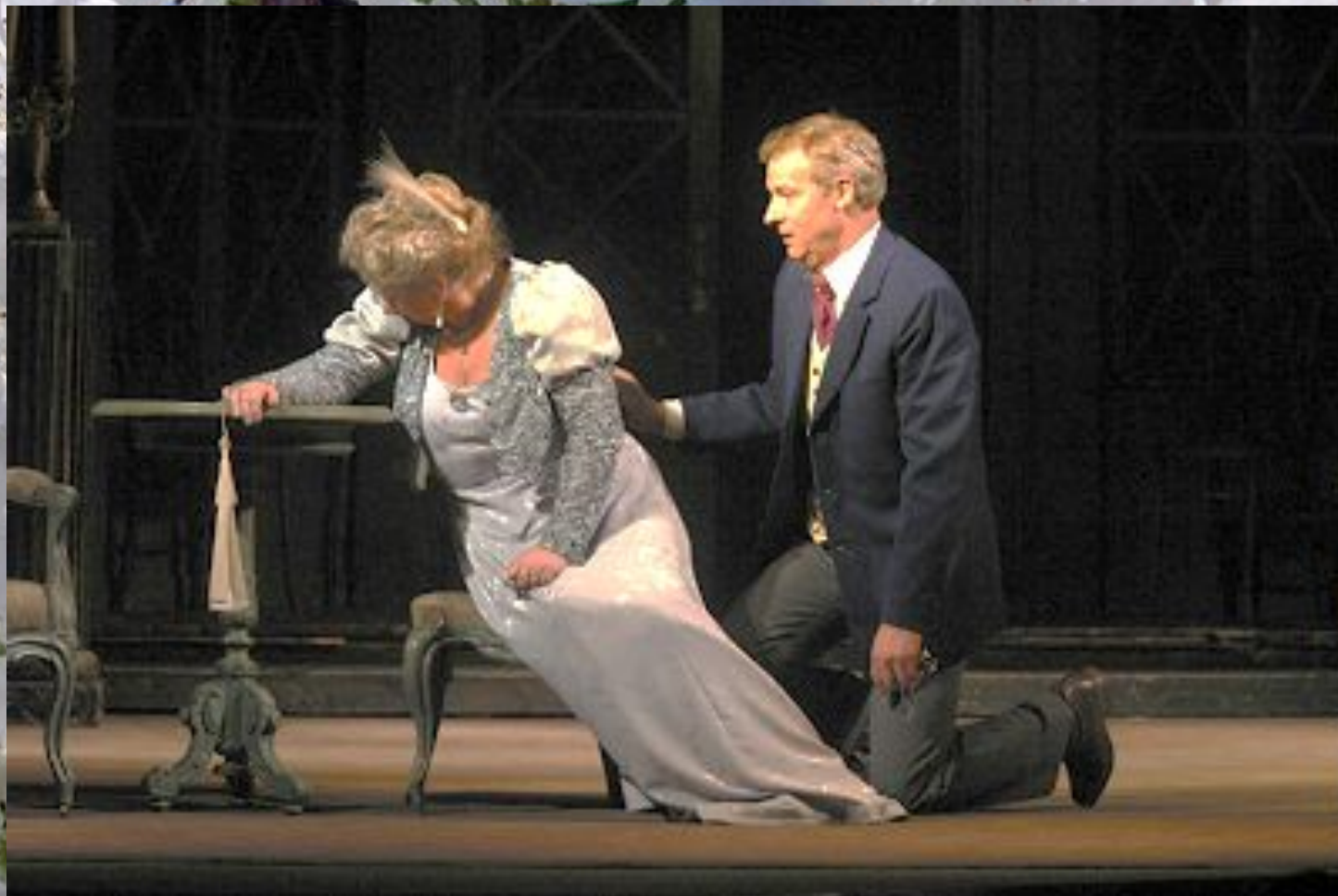
Лопахин и Л.А. Раневская