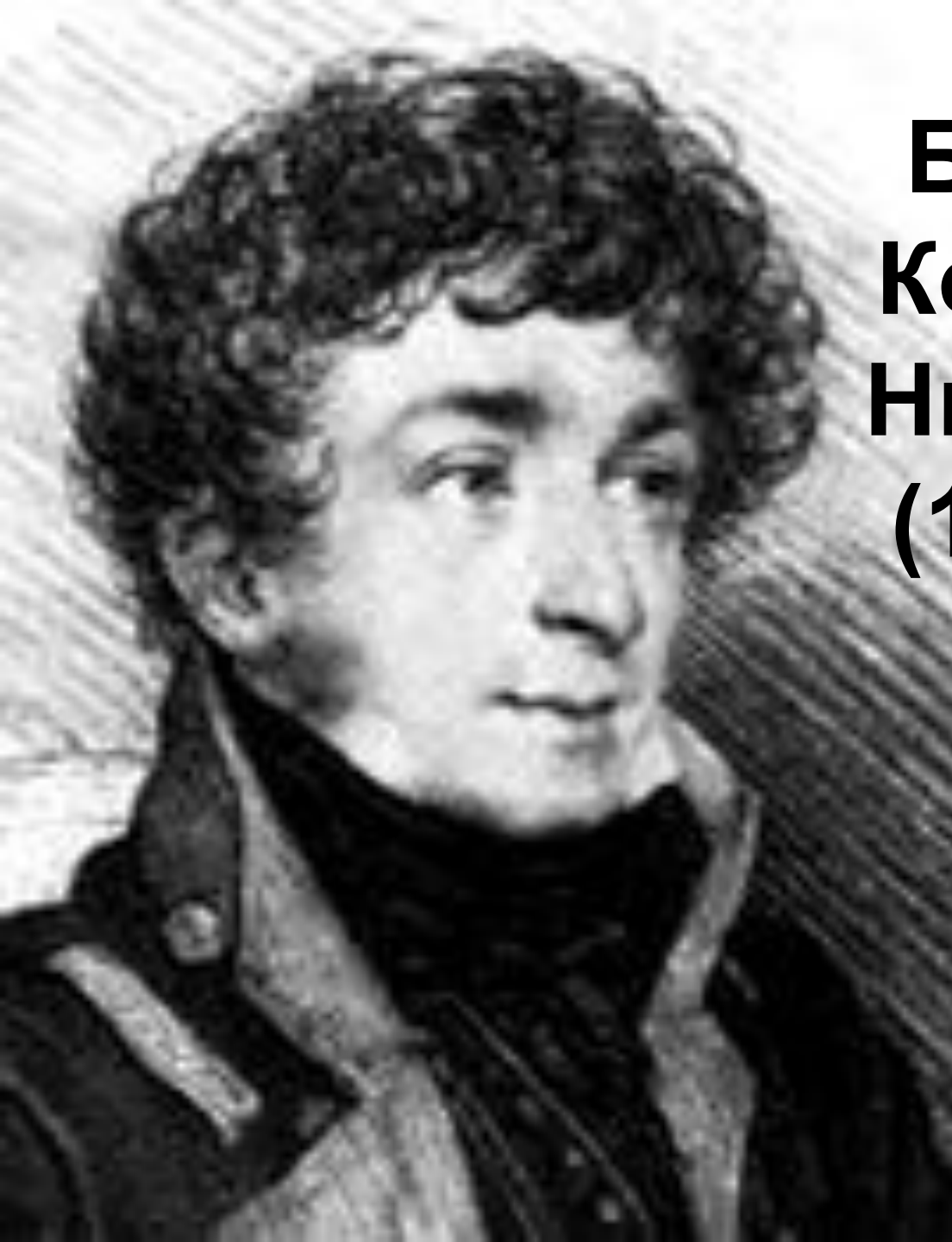
Батюшков Константин Николаевич (1787-1855)