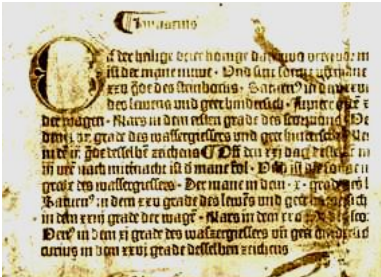
Первая книга Гутенберга «Страшный суд», 1455год