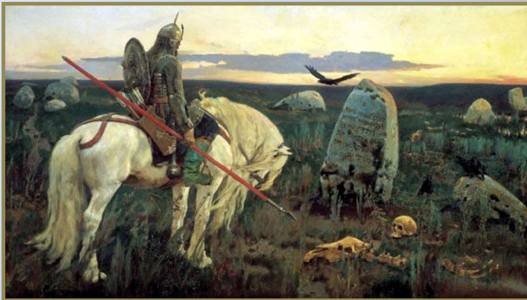
В. Васнецов. Витязь на распутье Холст, масло. 1882 г. Москва, Россия. Государственная Третьяковская галерея