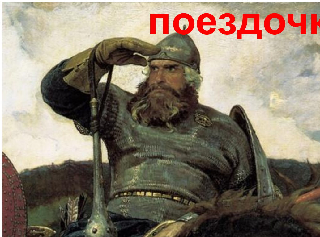
В. Васнецов. Илья Муромец. (Фрагмент картины «Богатыри»)