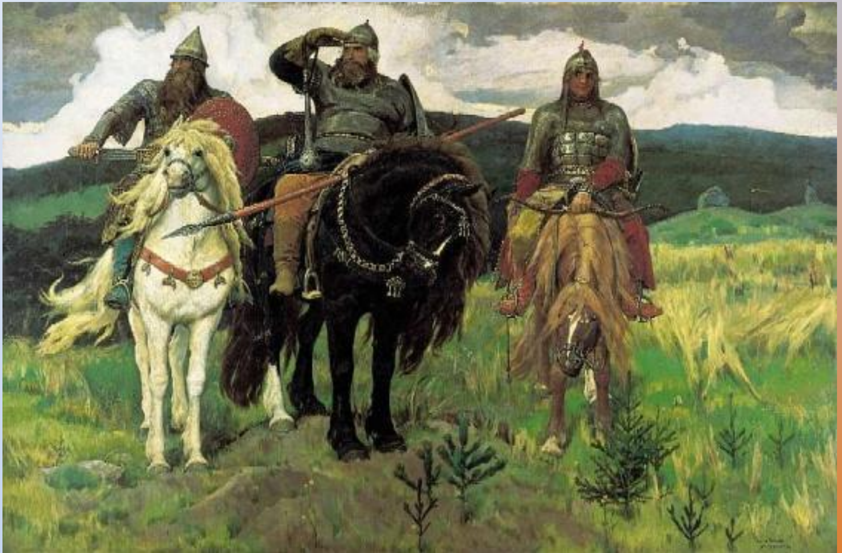
В. Васнецов. Богатыри 1881-1898, холст, масло, 295,3х446 см Государственная Третьяковская галерея, Москва