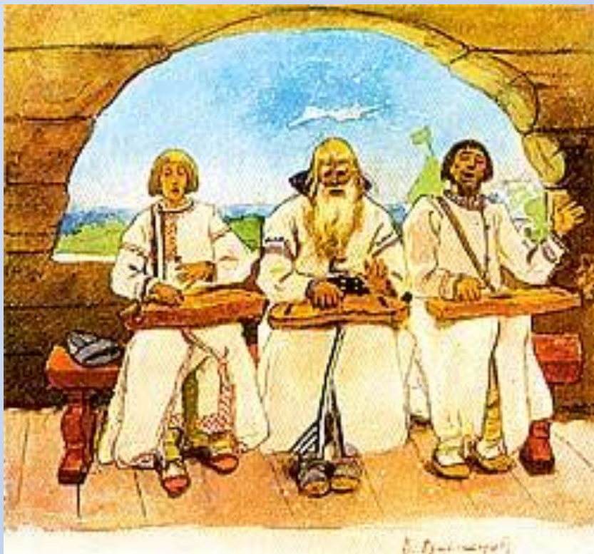
Виктор Михайлович Васнецов «Гуслияры»

В древности сказители подыгрывали себе на гусях, позже былины исполнялись речитативом. Для былин характерен особый чисто-тонический былинный стих. Хотя сказители использовали при исполнении былин всего несколько мелодий, они обогащали пение разнообразием интонаций, а также меняли тембр голоса.