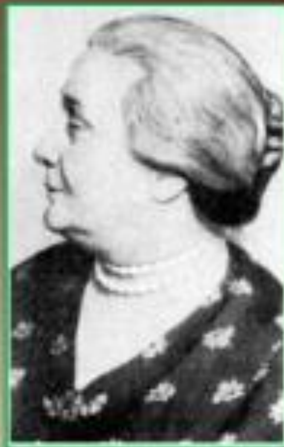
Анна Ахматова. 1965

О своем я уже не заплачу, Но не видеть бы мне на земле Золотое клеймо неудачи На еще безмятежном челе. (1962)