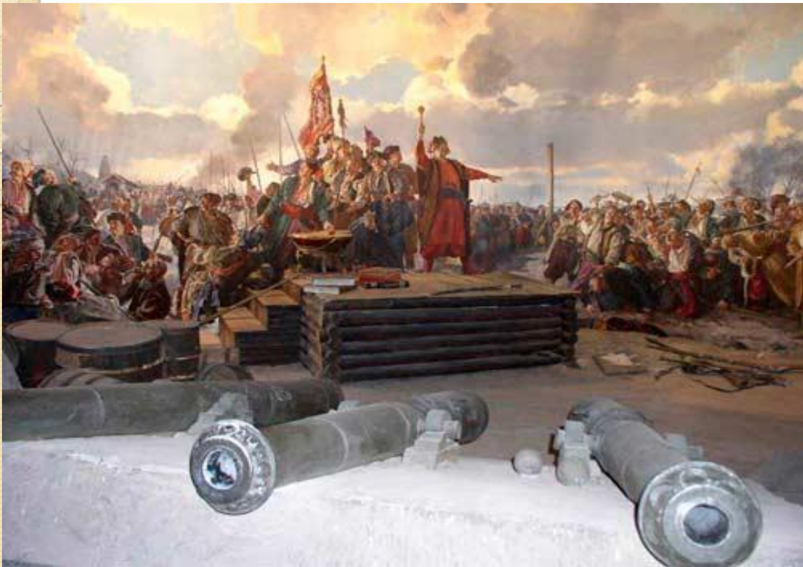
Казацкая рада в Запорожской Сечи.