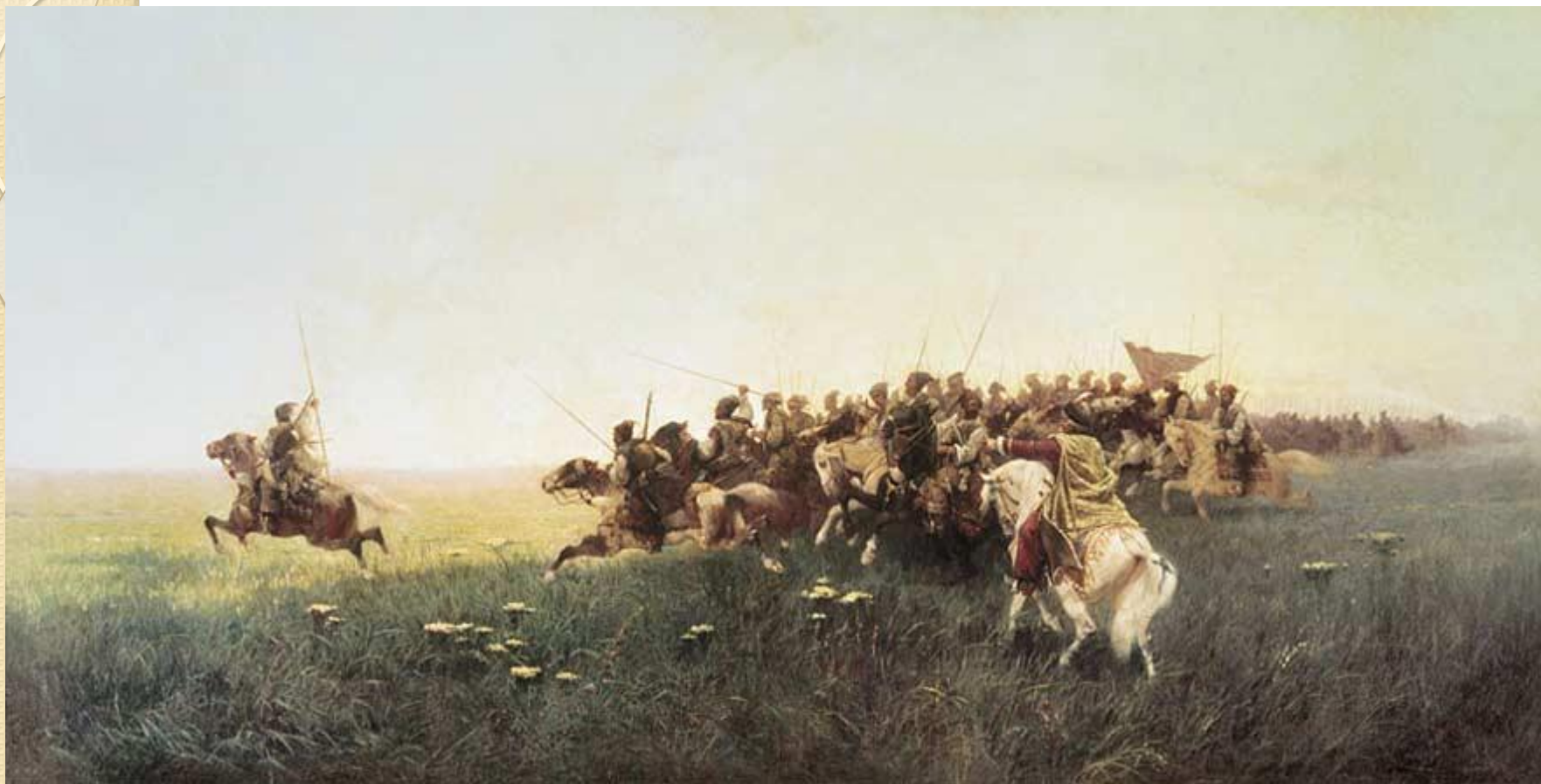
Атака запорожцев в степи. Картина Ф. Рубо, 1881