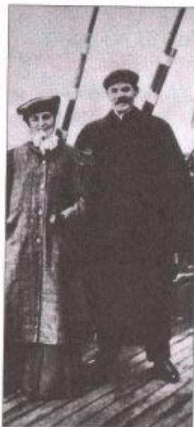
М. Горький и М. Андреева на пути в Америку. 1906

Статья «Буря энтузиазма...» о приезде Горького в США в газете «Нью-Йорк Таймс»