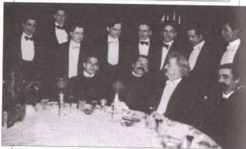
Максим Горький и Марк Твен в клубе писателей. Нью-Йорк, 1906

С 1921 по 1928 Горький жил в эмиграции, куда отправился после слишком настойчивых советов Ленина. Поселился в Сорренто (Италия), не прерывая связей с молодой советской литературой.