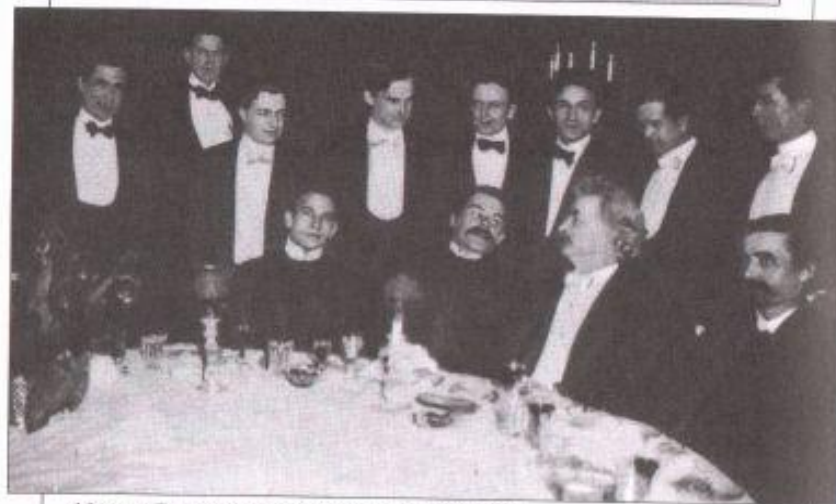
Максим Горький и Марк Твен в клубе писателей. Нью-Йорк, 1906

С 1921 по 1928 Горький жил в эмиграции, куда отправился после слишком настойчивых советов Ленина. Поселился в Сорренто (Италия), не прерывая связей с молодой советской литературой.