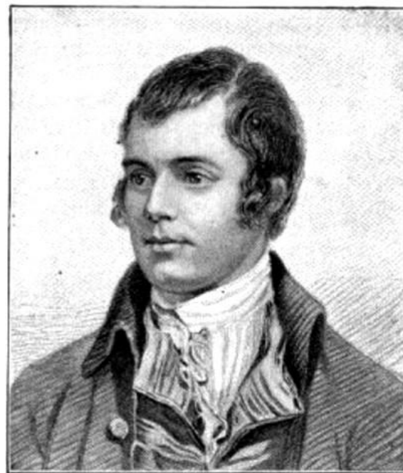
From the painting by Nasmyth, National Portrait Gallery.

«Чтение хороших книг - это разговор с самыми лучшими людьми прошедших времен, и при том такой разговор, когда они сообщают нам только лучшие свои мысли... о добре и зле, о любви и преданности, о вере и безверии, о милосердии и справедливости...»