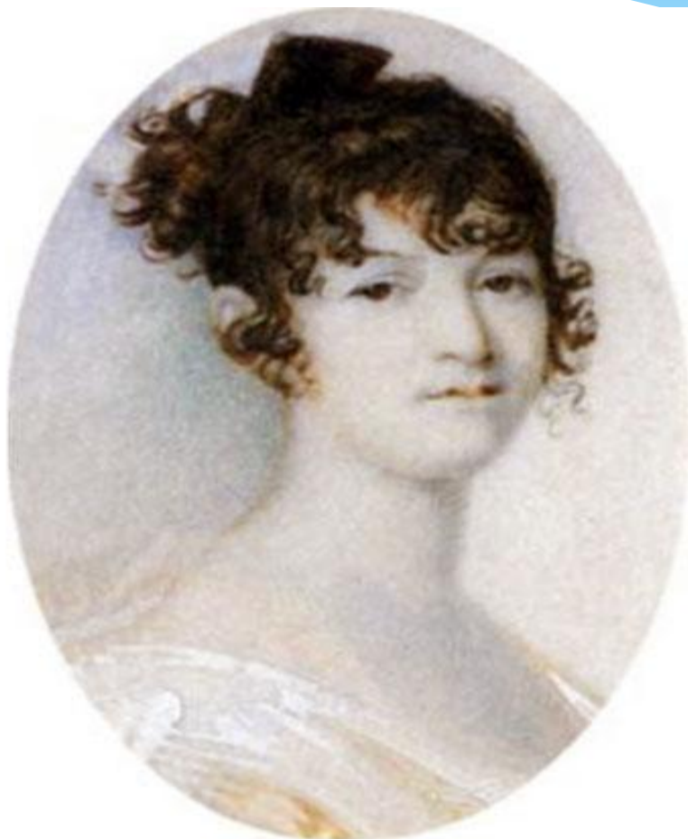
Надежда Осиповна Пушкина, урожд. Ганнибал (1775-1836), мать поэта А.С. Пушкина. Художник Ксавье де Местр. 1810

Сергей Львович был потомком знатного рода. Он любил литературу, был дружен с известными русскими писателями, собрал богатую библиотеку. Надежда Осиповна, урождённая Ганнибал, внучка «арапа Петра Великого», была образованна, остроумна, хороша собой, любила развлечения, блистала на балах.