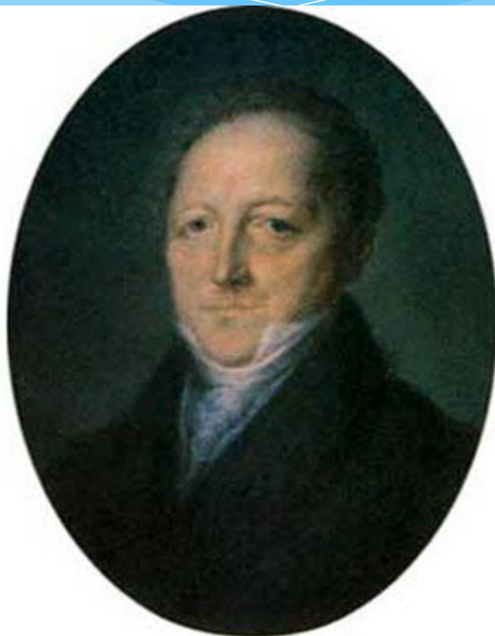
Сергей Львович Пушкин (1770-1848), отец поэта А.С.Пушкина Неизв. художник. 1810-е гг.