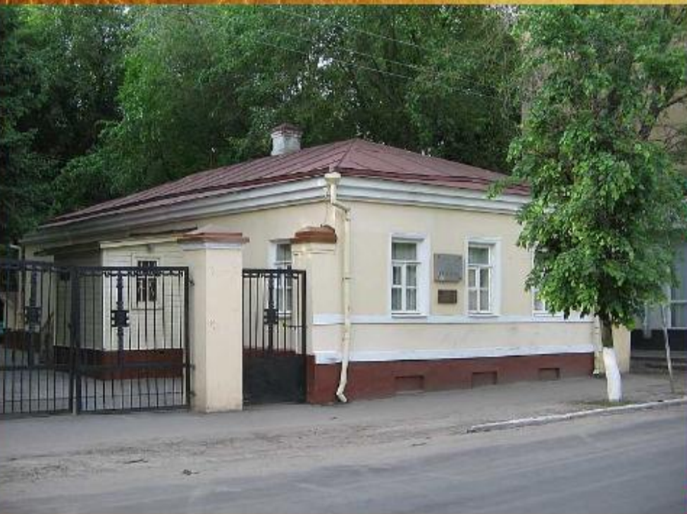
Дом-музей И. Никитина в Воронеже

Родился 1 сентября 1824 года Воронеже. Отец был торговцем - владел свечным заводом и лавкой.