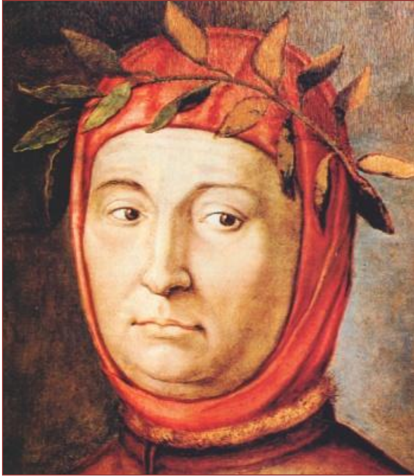
Франческо Петрарка (1304-1374)