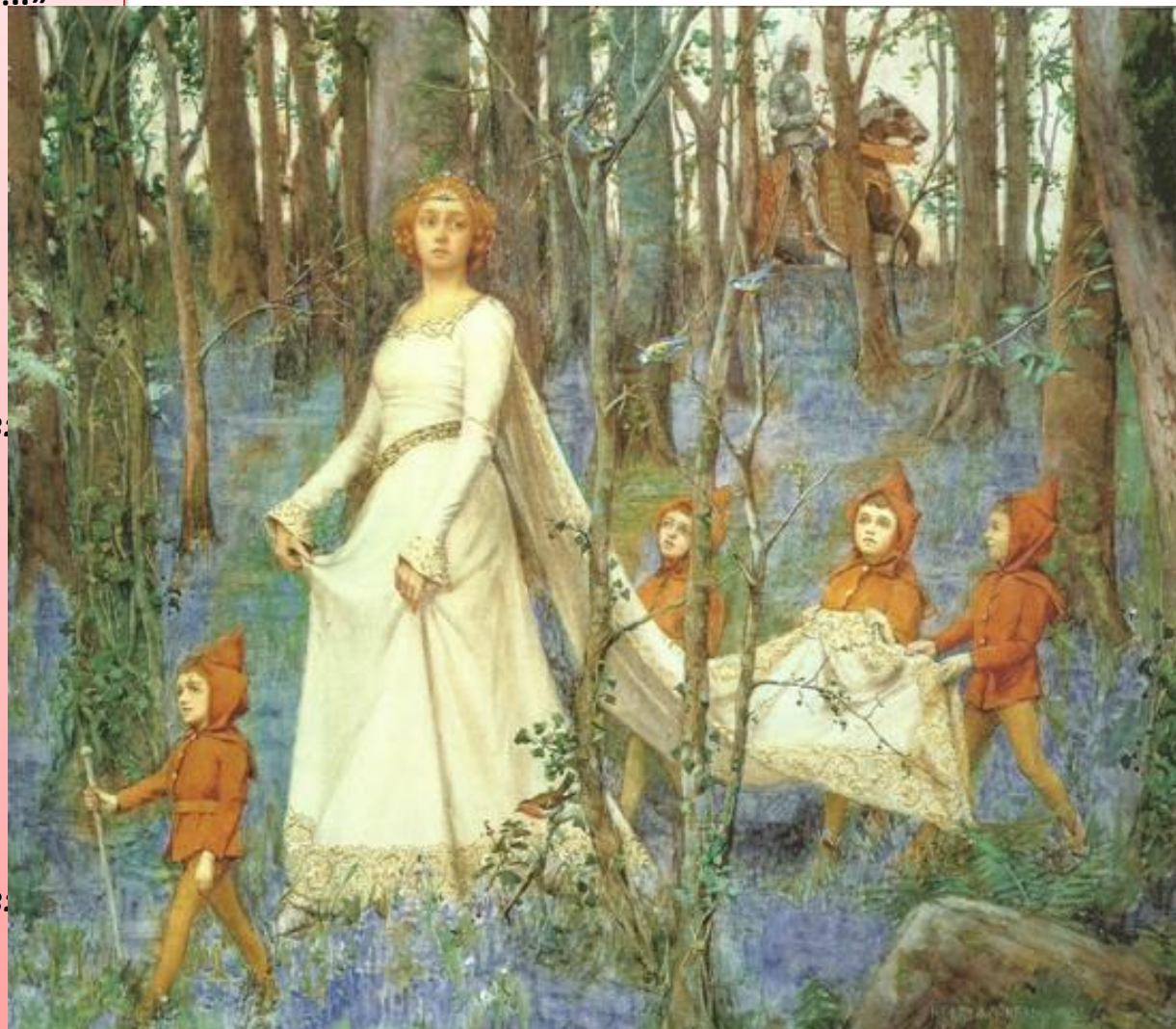
Королева – весна. Она приходит вместе с апрелем. Король-ревнивец – зима.