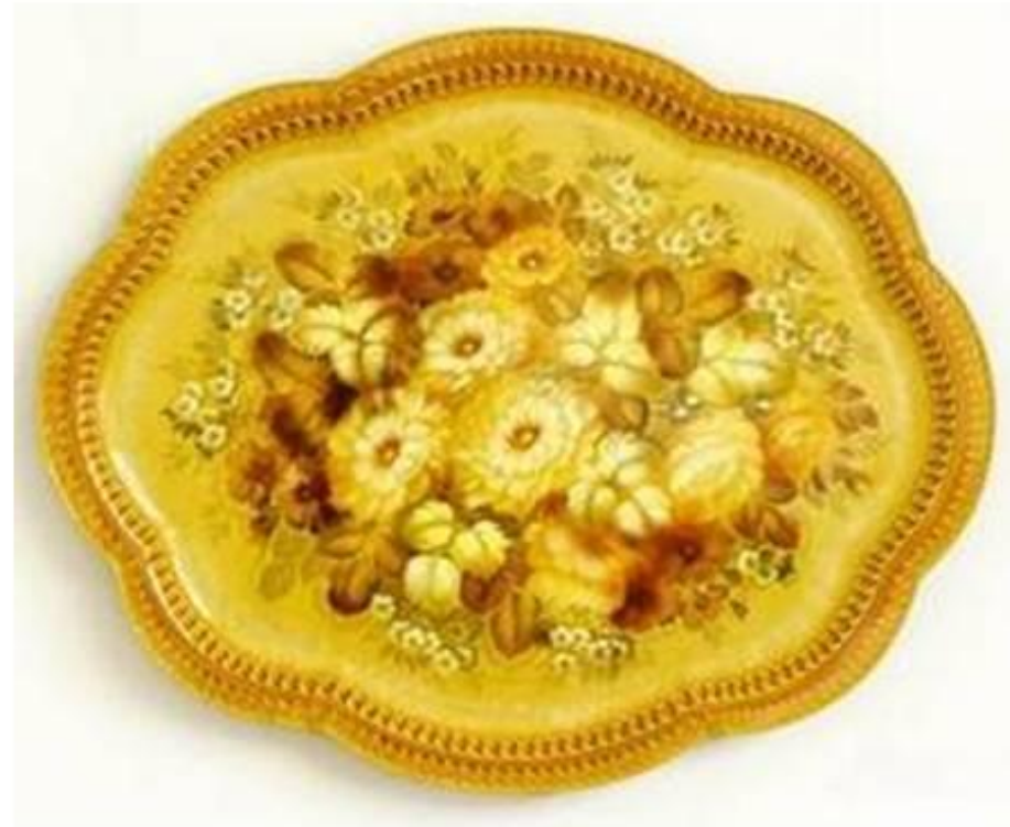
Художник - Домникова М. Е. Жостовский поднос "Осенний мотив".