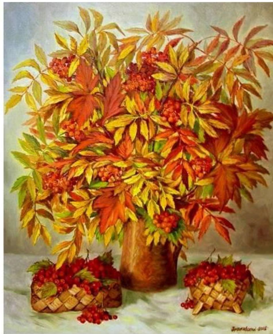
Аркадий Зражевский. Листья рябины.