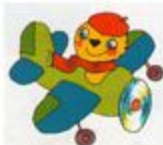
Рис. В. Дми́трика