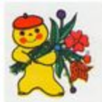
Рис. В. Хлебникова