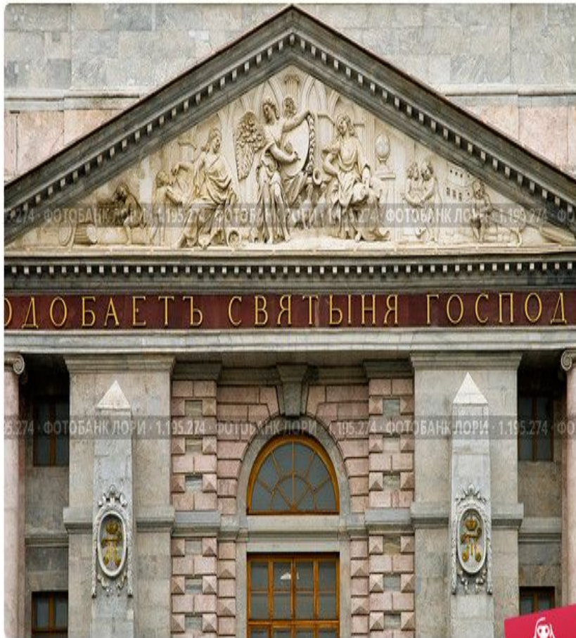
Михайловский замок. Фронтон. Санкт-Петербург