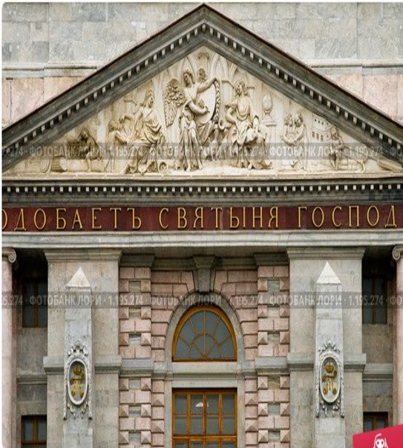
Михайловский замок. Фронтон. Санкт-Петербург