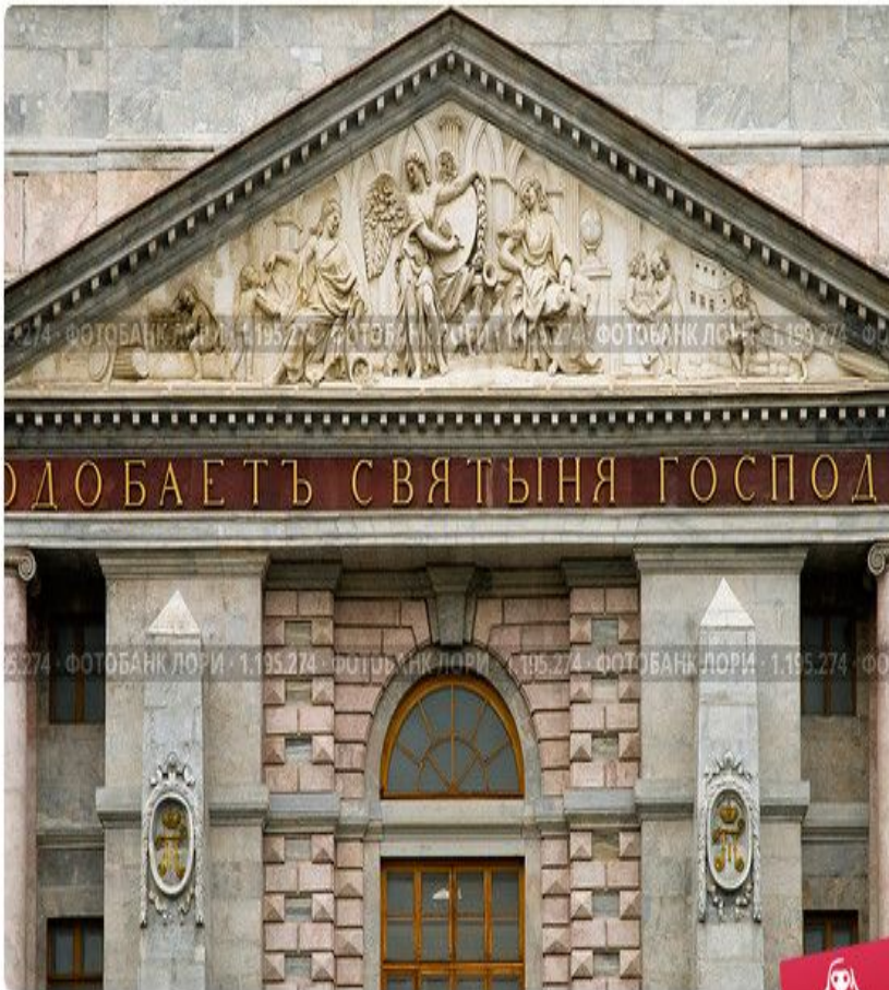
Михайловский замок. Фронтон. Санкт-Петербург