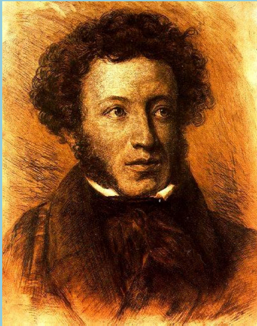
Александр Пушкин -1799-1837