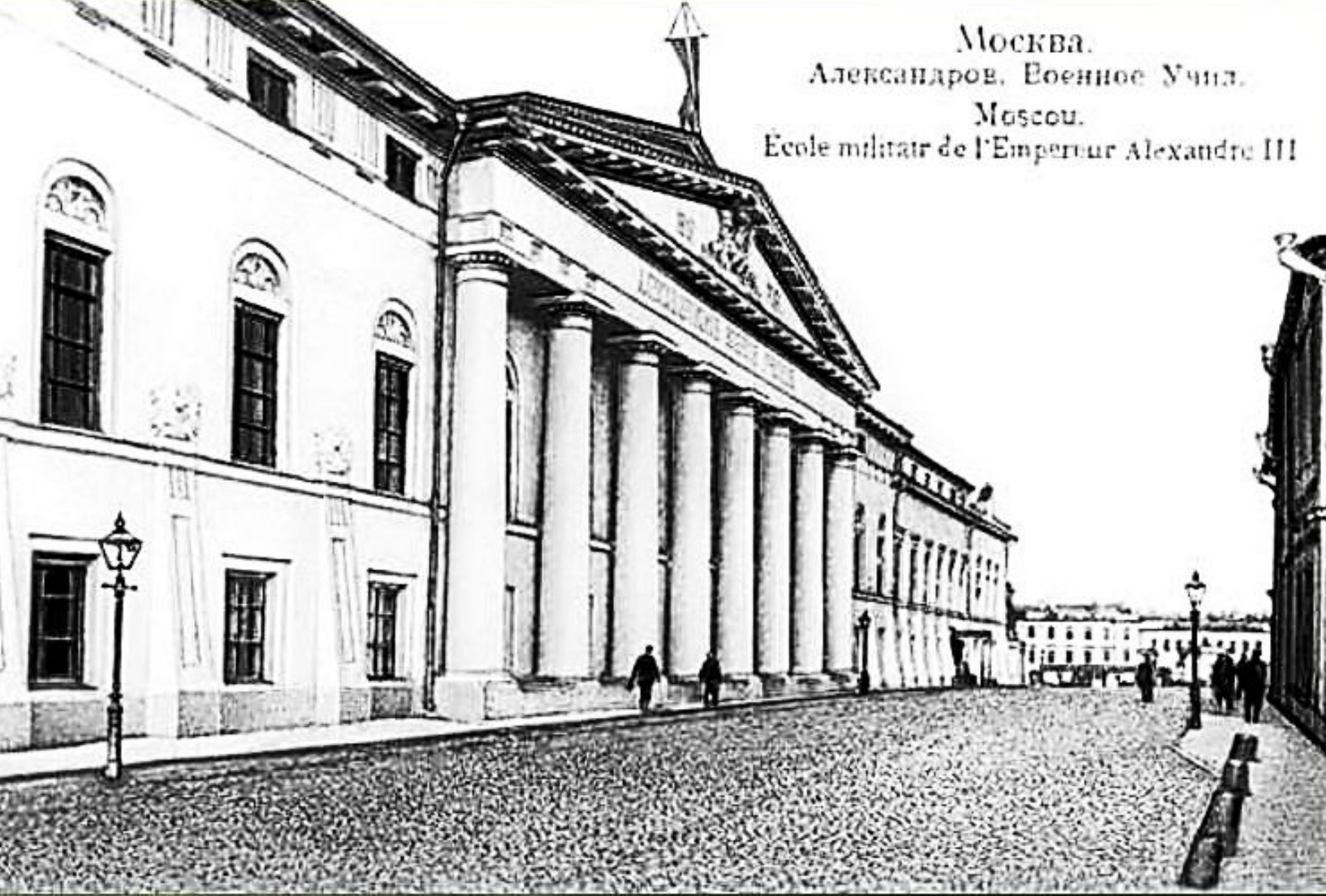
Вторая московская военная академия.

Москва. Александров. Военное Учил. Moscou. Ecole militair de l'Empereur Alexandre III