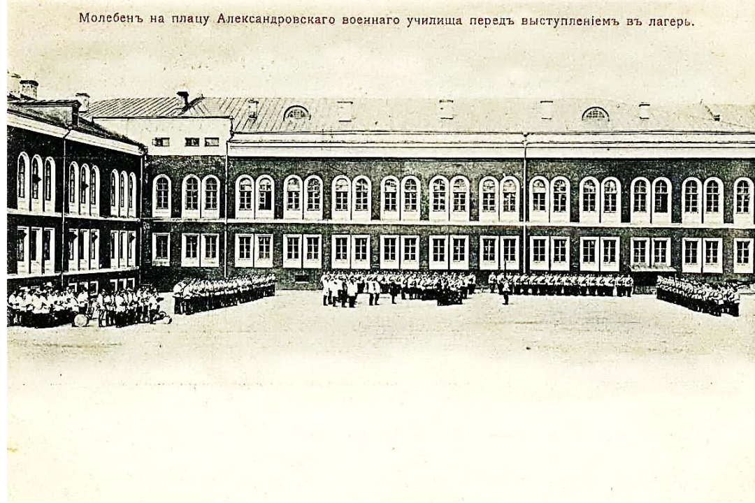
Молебенъ на плацу Александровскаго военного училища передъ выступленіемъ въ лагерь.