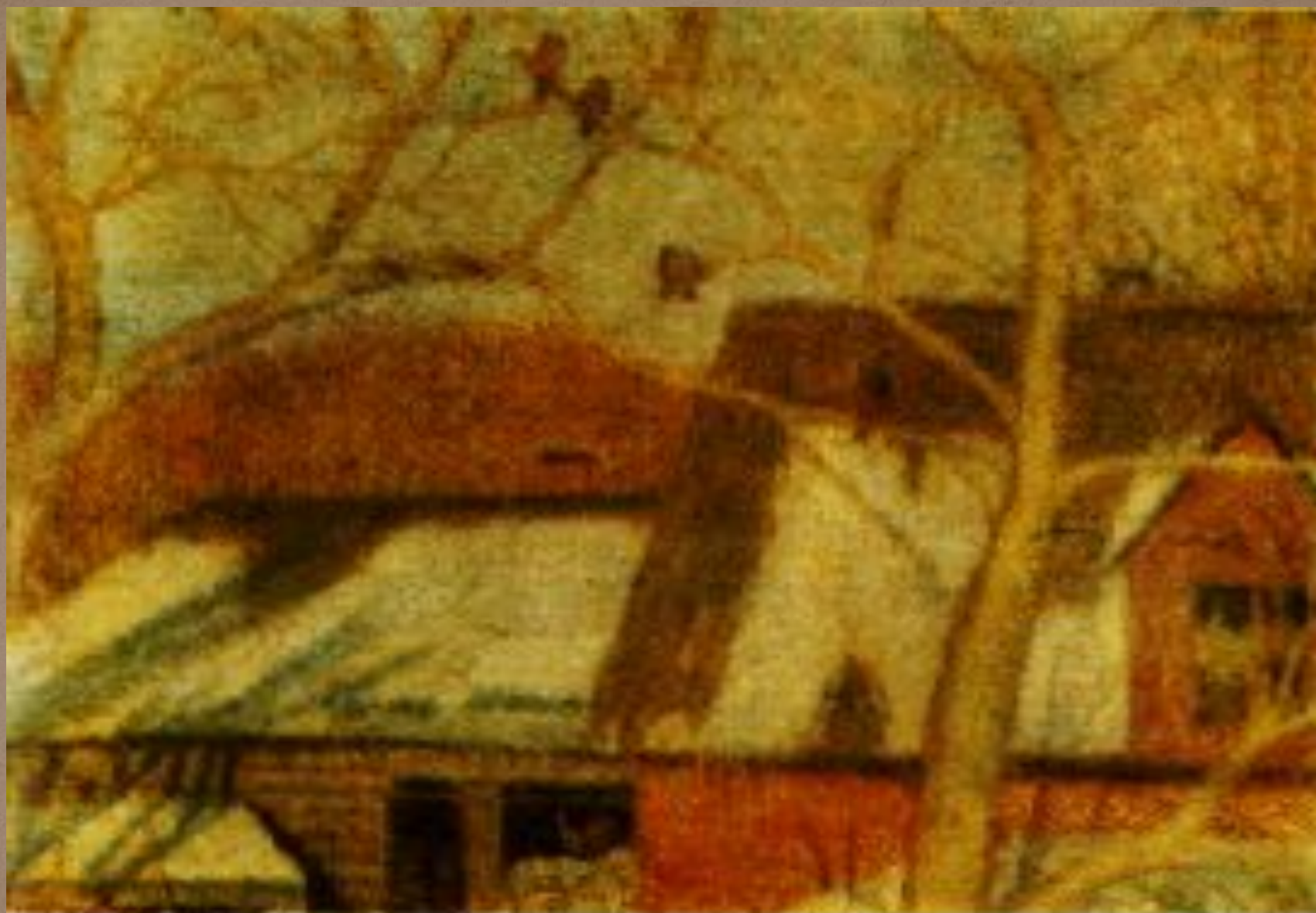
Н. Крымов. К весне. 1907. Х., масло. ГТГ