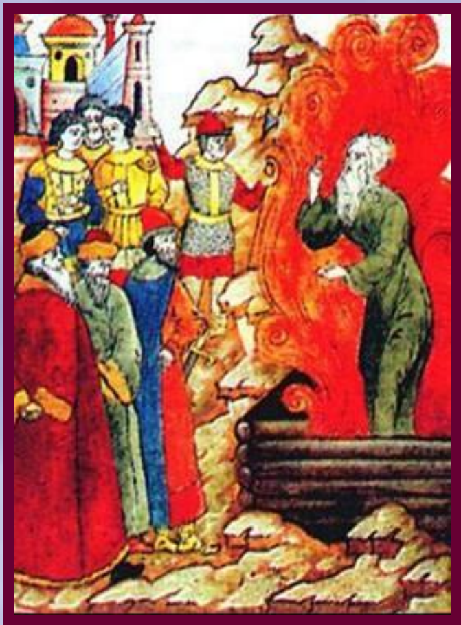
Сожжение протопопа Аввакума. Миниатюра конца XVII в.

В 1682 г. по царскому приказу он был сожжен вместе со своими соратниками.