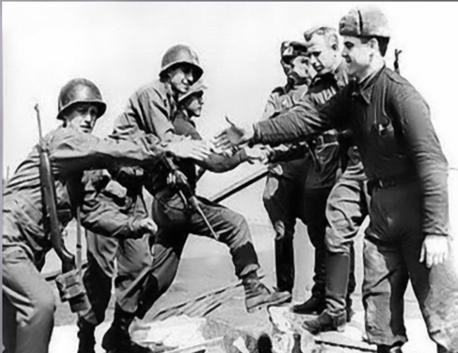
Встреча с американцами на Эльбе.