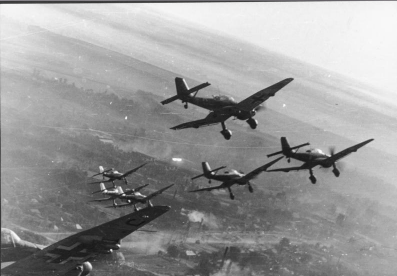
1943/1944 Winter