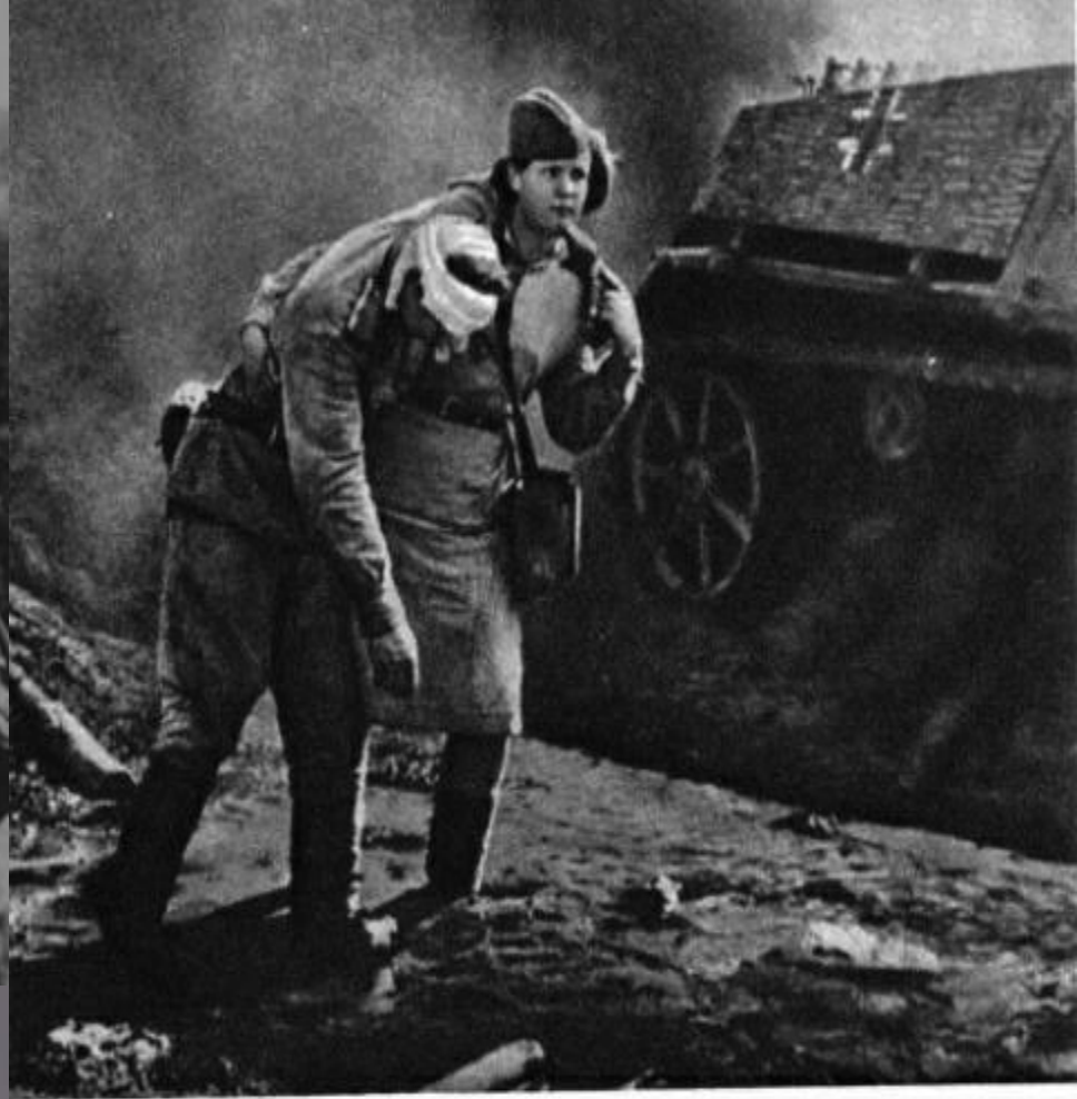
Спасая раненого воина...