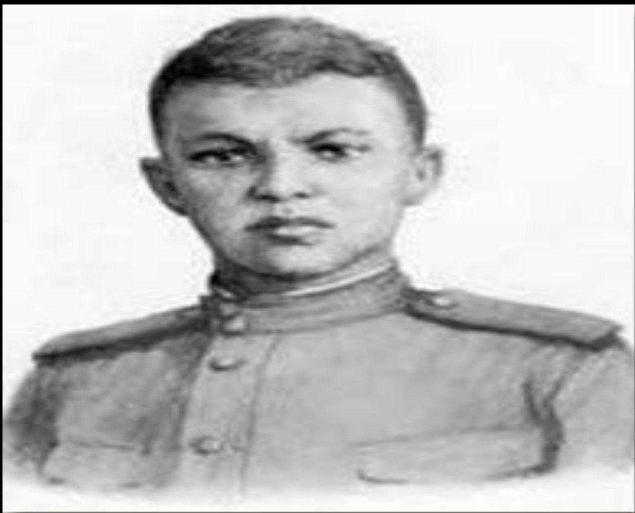
Герой Советского Союза Александр Матросов