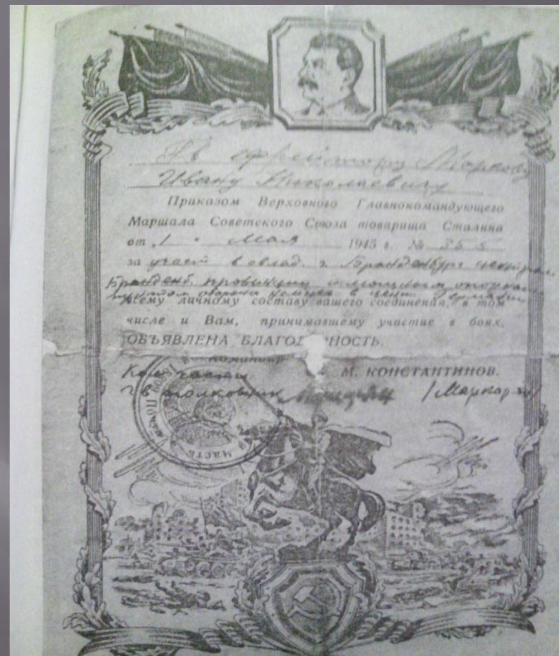
Благодарственные письма от Маршала Советского Союза товарища Сталина