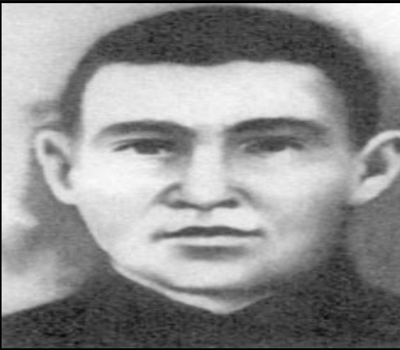
Герой Советского Союза Хакимьян Ахметгалин