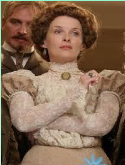
Любовь Андреевна Раневская