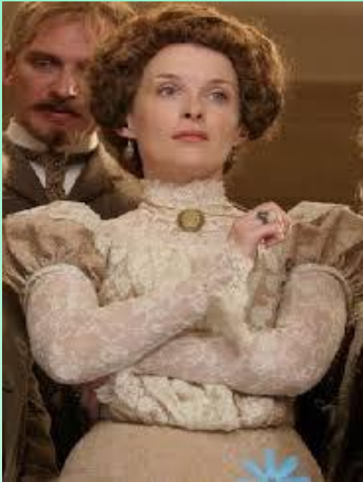
Любовь Андреевна Раневская