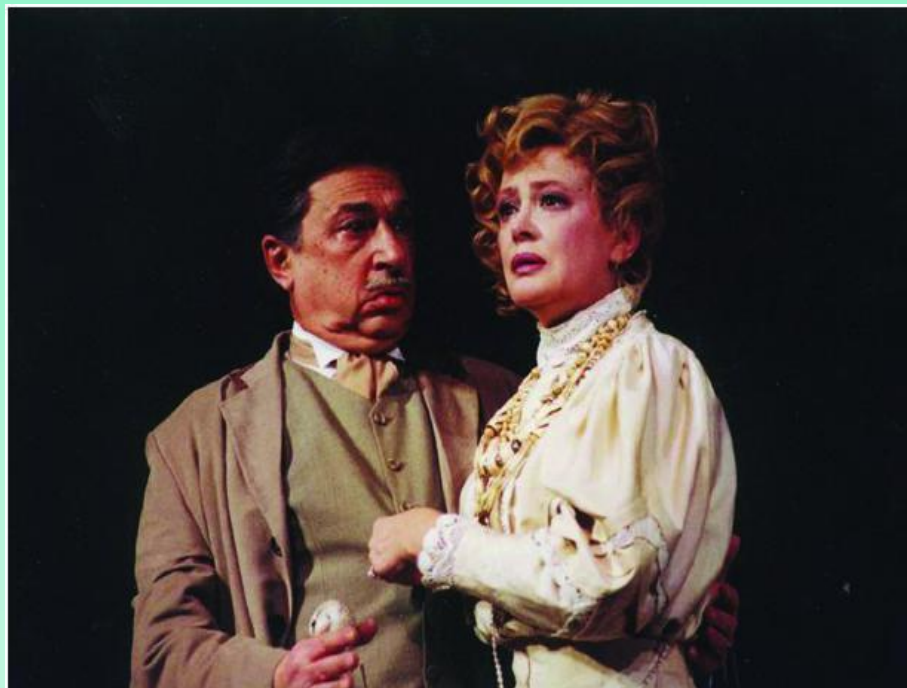
Гаев – брат Раневской

Это люди «эгоистичные, как дети, и дряблые, как старики. Они опоздали вовремя умереть и ноют, ничего не видя вокруг себя и ничего не понимая.