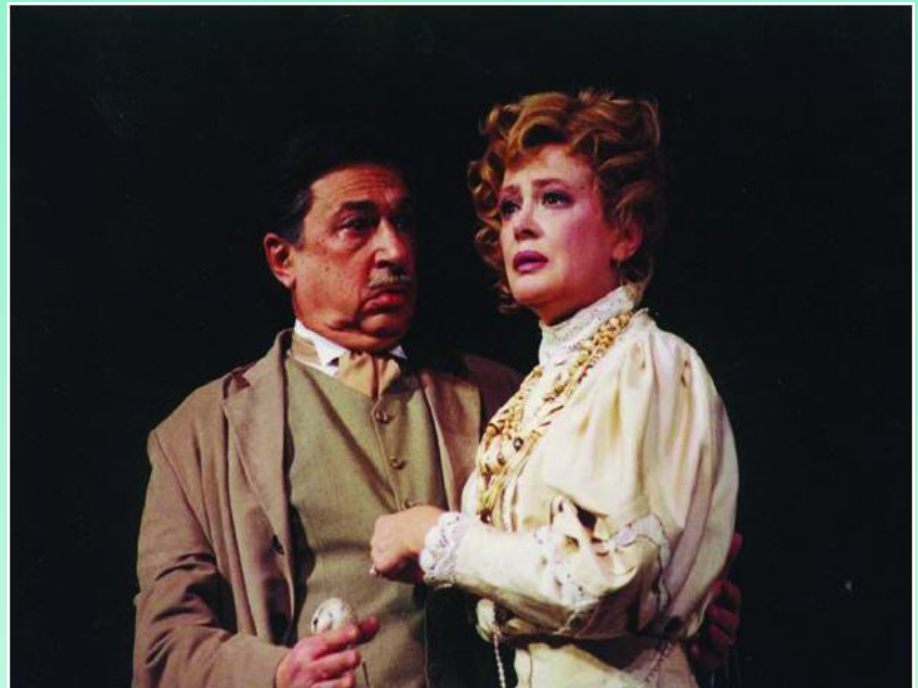
Гаев – брат Раневской

Это люди «эгоистичные, как дети, и дряблые, как старики. Они опоздали вовремя умереть и ноют, ничего не видя вокруг себя и ничего не понимая.