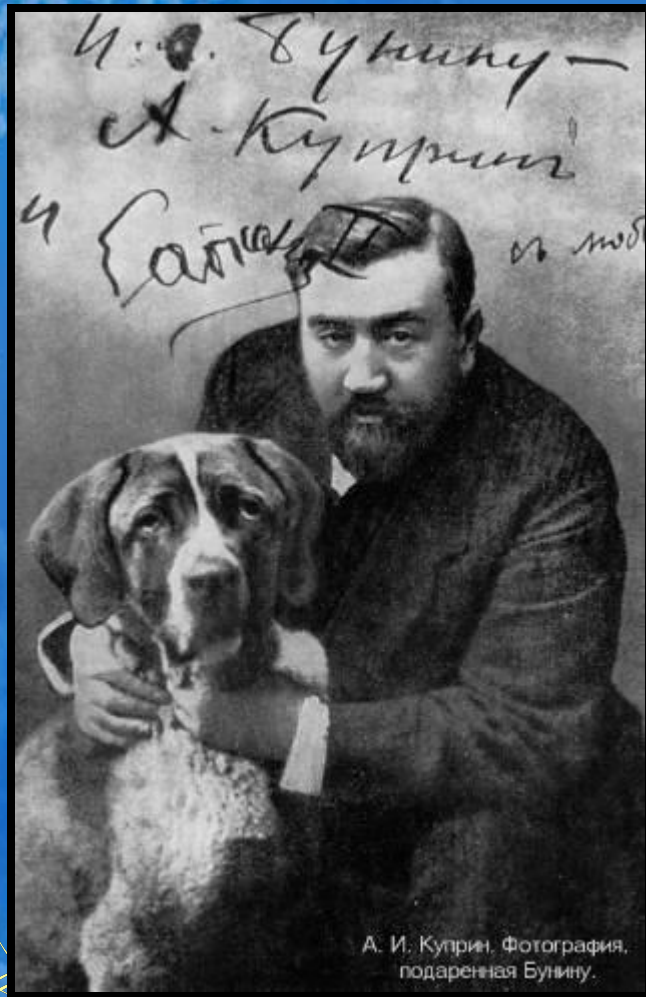
А. И. Куприн. Фотография, подаренная Бунину.

Февральскую революцию Куприн встретил восторженно. . В его художественных произведениях этой поры (рассказы "Храбрые беглецы", "Сашка и Яшка", "Гусеница", "Звезда Соломона") нет прямых откликов на бурные события, переживаемые страной.