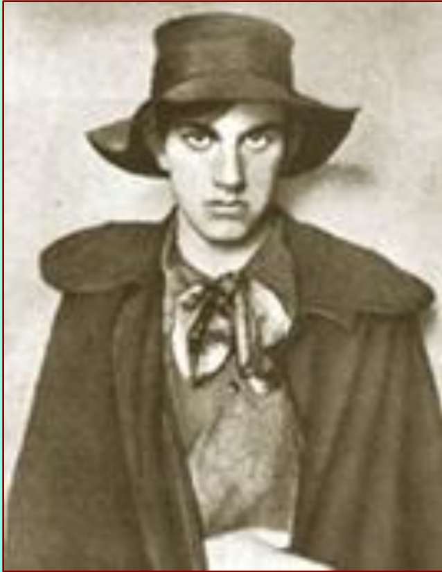
Владимир Маяковский 1893-1930

Родился 7 июля 1893 в селе Багдади в семье лесничего. Маяковский учился в московской гимназии. Трижды подвергался арестам, в 1909 был заключён в одиночную камеру Бутырской тюрьмы. Выйдя из тюрьмы, где он начал писать стихи, Маяковский решает "делать социалистическое искусство": "Я прервал партийную работу. Я сел учиться".