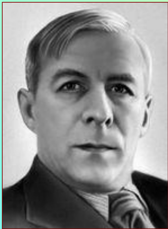
Николай Асеев 1889-1963

Русский поэт. Родился 28 июня (10 июля) 1889 в Льгове Курской губ. Сын страхового агента. Окончил Курское реальное училище (1907), учился в Московском коммерческом институте (1908–1910), был вольнослушателем Московского университета. 1914г. – Асеев – один из организаторов литературной группы «Лирень».