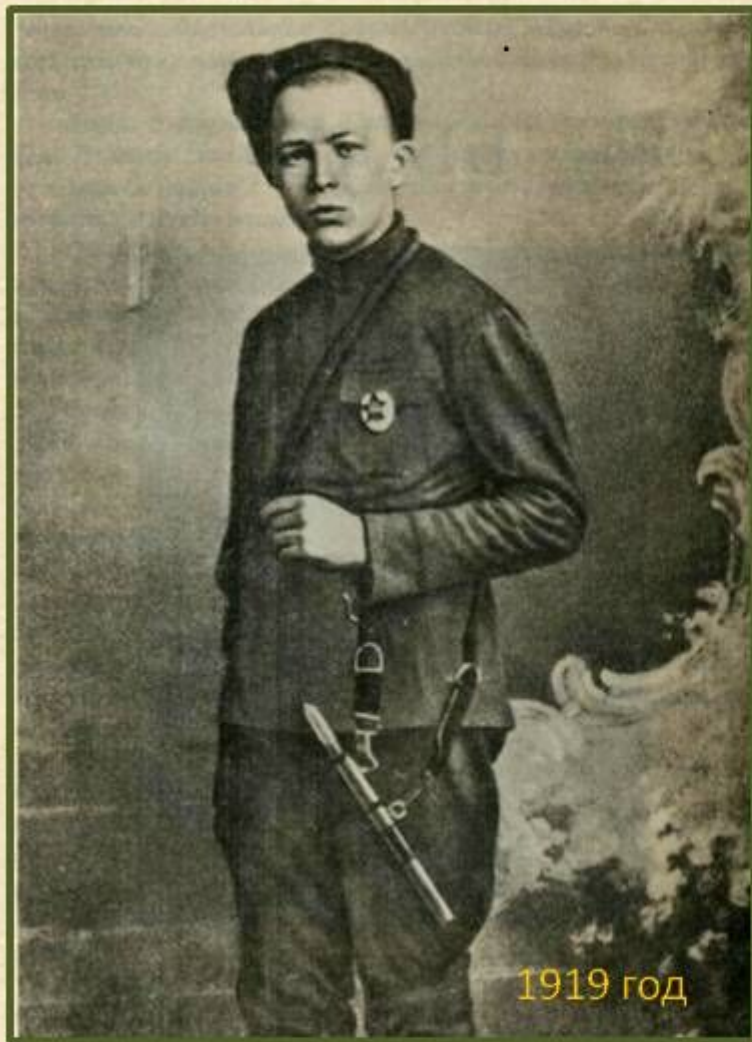
Аркадий Петрович Гайдар 1904-1941

Настоящее имя - Аркадий Петрович Голиков