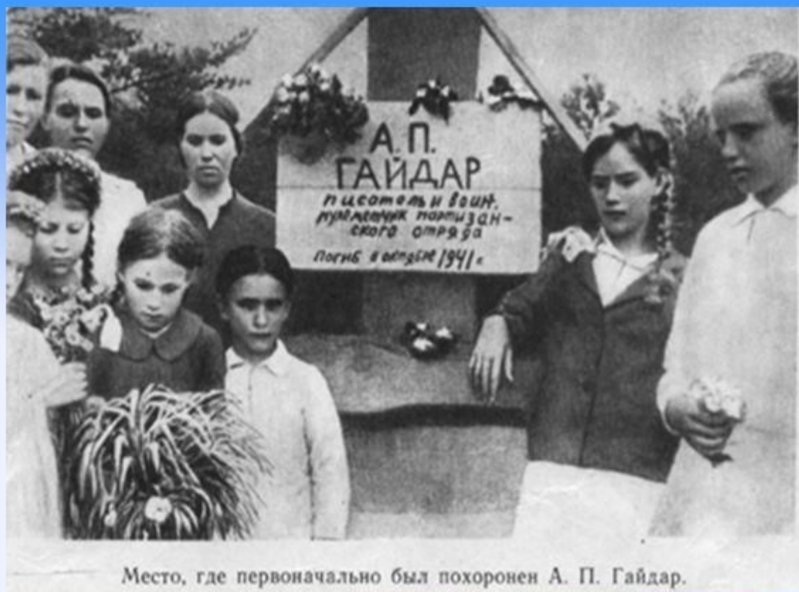
Место, где первоначально был похоронен А. П. Гайдар.

Гайдар погиб 26 октября 1941 года в результат е стычки с немецкой засадой.