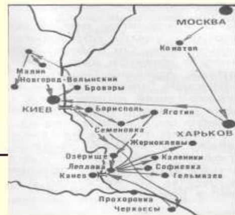
Карта боевых дорог А.Гайдара.