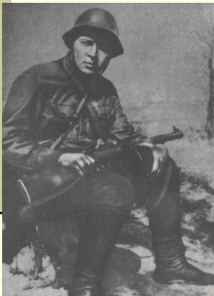
А.Гайдар на фронте. 1941 г.

«Не хочу быть в запасе», - писал 22 июня 1941 года Аркадий Гайдар в заявлении отправить его на фронт.