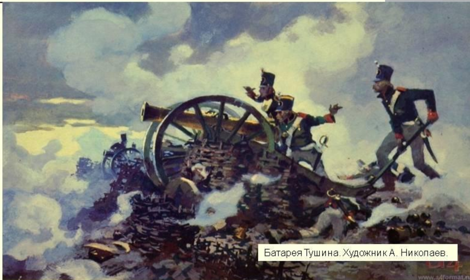
Батарея Тушина. Художник А. Николаев.