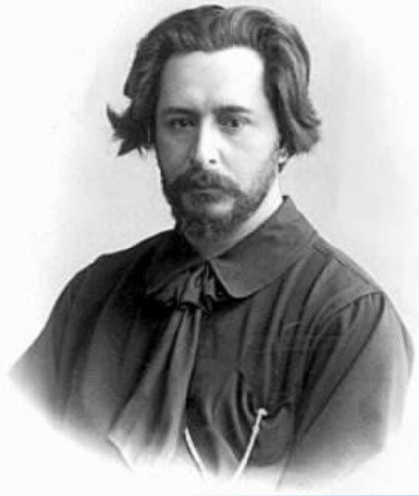
* Леонид Николаевич Андреев