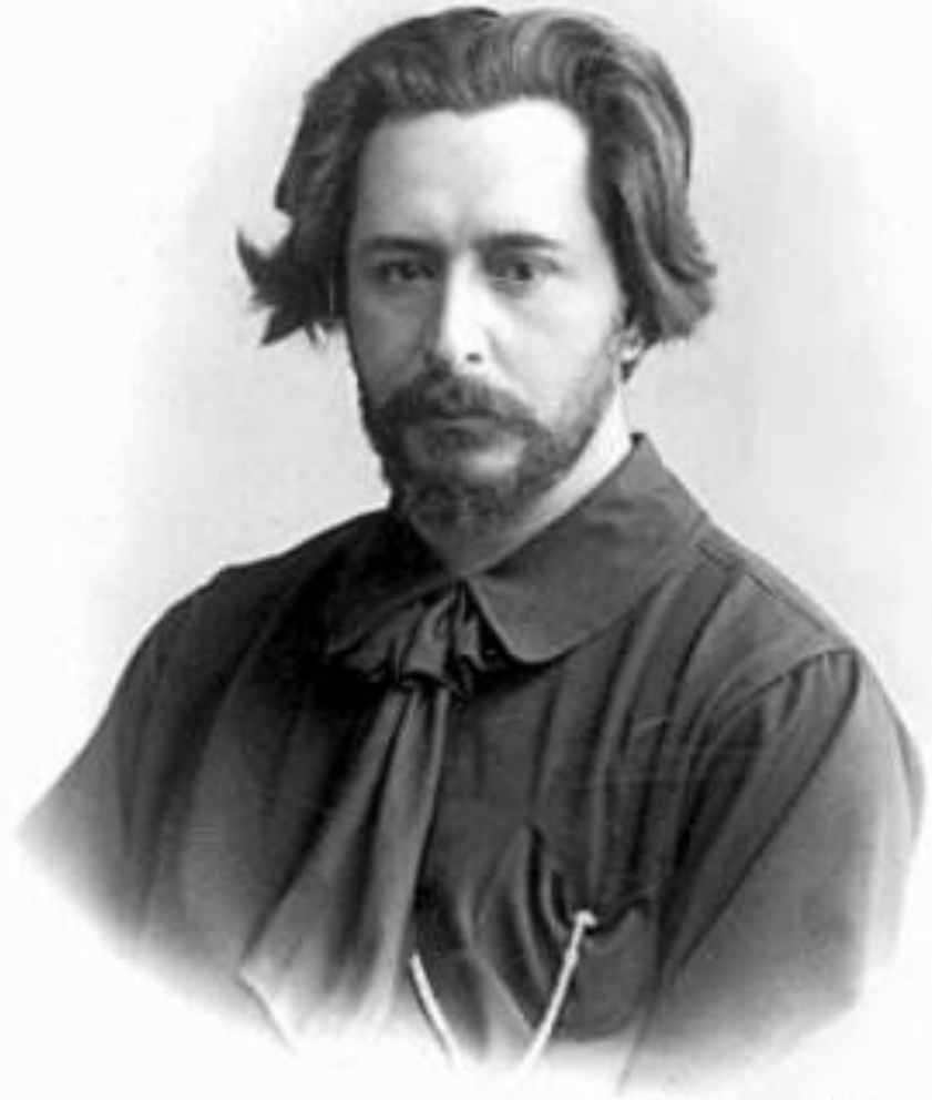
* Леонид Николаевич Андреев