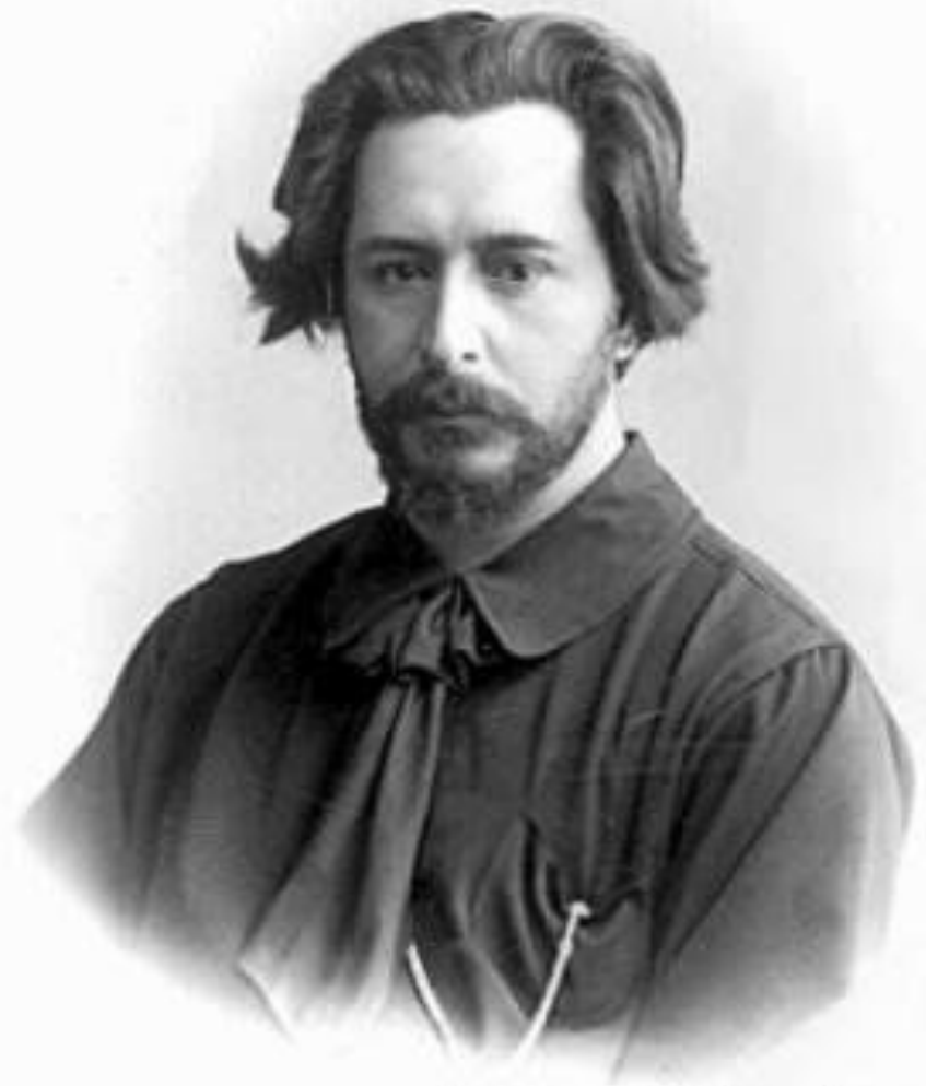
* Леонид Николаевич Андреев