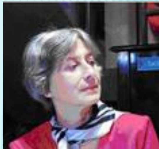
Ольга Александровна Седакова