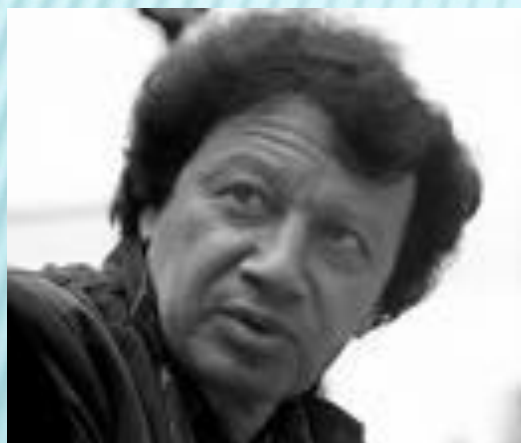
Алексей Максимович Парщиков

-Выделите в поэзии метареализма основные темы. Что более всего интересует их?