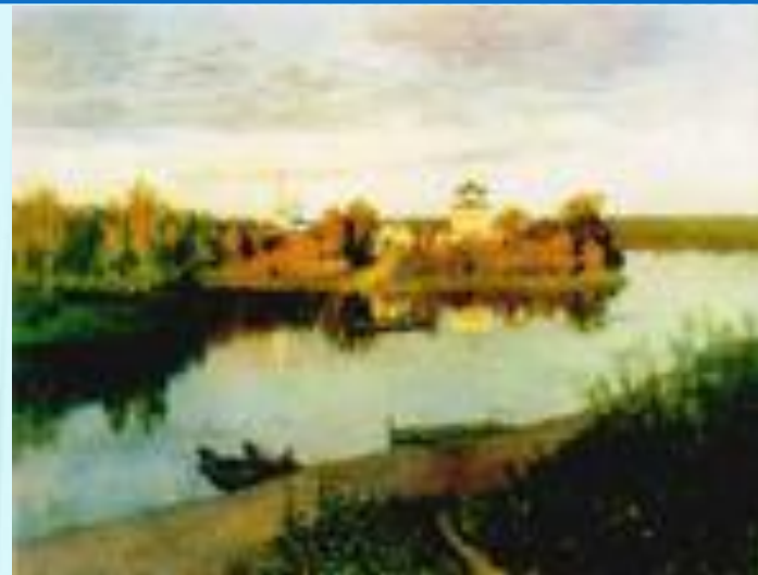
Левитан И. И.