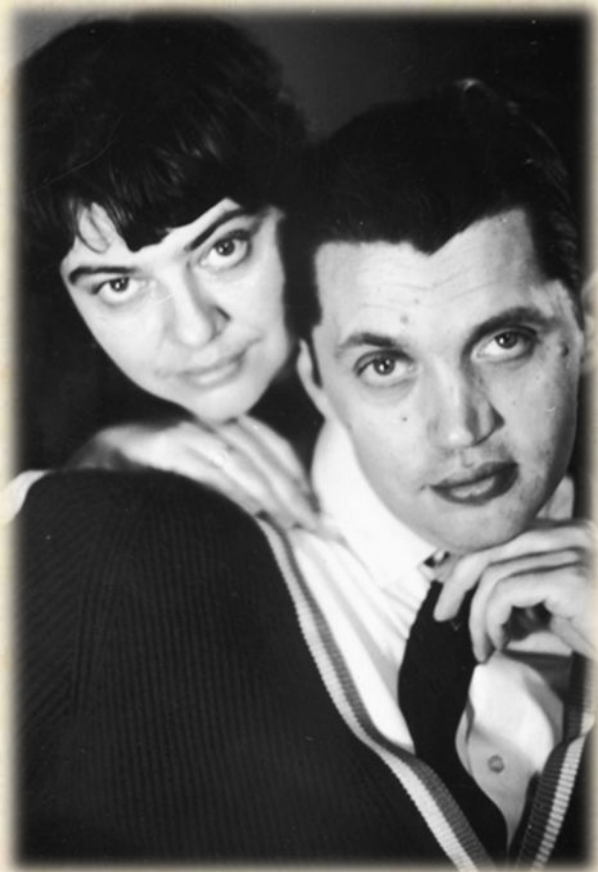
Поэт с супругой Аллой