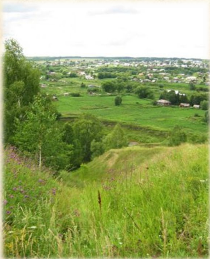
Село Косиха Алтайского края

Родился я в селе Косиха Дождливым летом на Алтае. А за селом синело поле И пахло ливнем переспелым.. Нет! Я родился много позже. Потом. В июне. В сорок первом. И жесткий голос Левитана Был колыбельною моею. Меня война в себя впитала. Я - сын ее. Я полон ею.